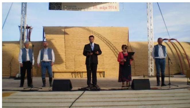
PFS 2014 v prírodnom amfiteátri pod vrchom Roh

„V Miškech Dedinke bola bohatá tradícia maškarných plesov, vianočných zábav a divadiel. Plesy a zábavy robili odjakživa hasiči, neskôr Telovýchovná jednota. Maškarné bývali parádne, bývalo aj 30 masiek. Niekedy takých, že nikto nevedel, kto to bol. Potom prišla taká doba, že zábavy sa už neoplácali. Nebol z toho zisk. A nakoľko sa tu kedysi na fašiangy ľudia radi bavili, prišli sme s nápadom, že budeme pochovávať basu. Inšpirovali ma k tomu v Starej Turej. Tam to potom prestalo fungovať a u nás sa rozvíjalo. Tento rok s FS