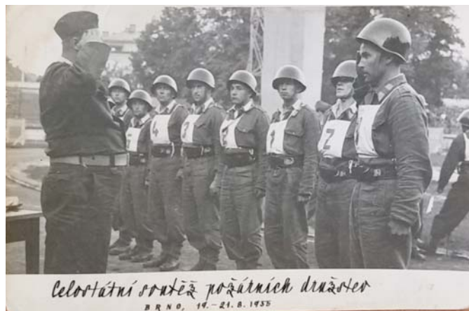
Brno 19.- 21.8.1955.

„Mi nižšie podpísaný Dobrovoľný hasič sa týmto zavazujeme to, že dobrovoľne dozboru hasičského stupujeme a šetky nám rozkazy dla stanov vidané verne plniť sceme či vedne alebo v noci napovel hlásnickéj trúby zme dicky hotoví sa ustanovít naurčité miesto, kde nám bude rozkas daný od veliteľa...Tedy toto naše prehlásenie nám bolo prečítané aj šetkýmý podpísané v Lubine- Miškech Dedinke dna 14. apríla 1909.“