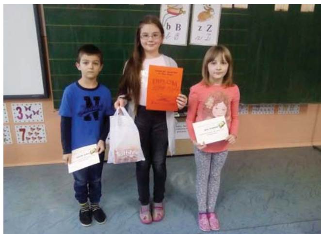
Vítazi školského kola v kategórii próza

17. 1. 2017 sa žiaci prvého stupňa stretli v jednej triede a jeden po druhom predniesli naučené texty. Hrdo a nebojáčne predstupovali pred porotu, aby ukázali, čo v nich drieme. Všetci so zatajeným dychom počúvali. Porota zložená s pani učiteľkami rozhodla, že do ďalšieho kola konajúceho sa 28. 2.