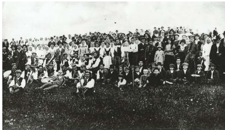
Výlet na Javorine 1922. Snem drobných pracovníkov.

Stretnutia národovcov robili krásy a starosti vtedajším maďarským politikom a boli už len sporadické v r. 1880, 1882.