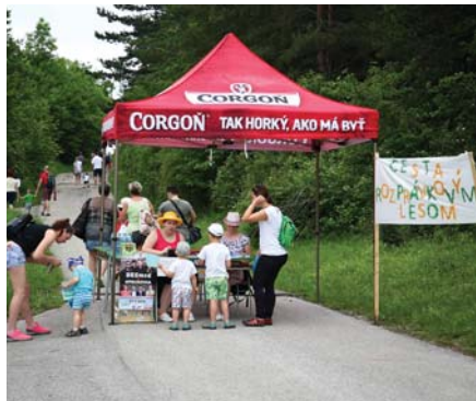
Takto to všetko začalo

V rozprávkovom duchu sa niesol aj ďalší ročník Cesty rozprávkovým lesom a oslavy MDD, kde hlavnými