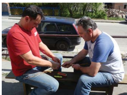
Krúpa s Chudíkom