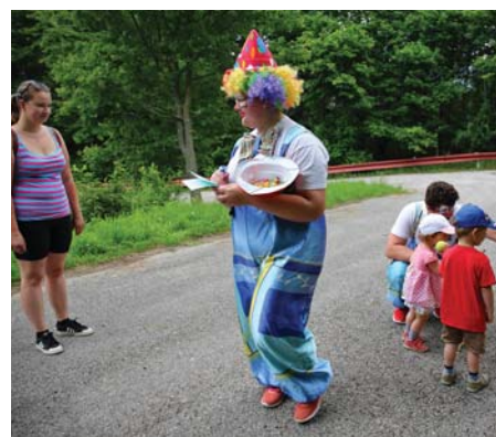
Boli tu šašovia