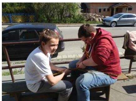
Bratranec s bratrancom

„Gdo sce bárkeré dievča milovat, mosí ho vedzet, mosí ho vedzet dobre vyšibat“.