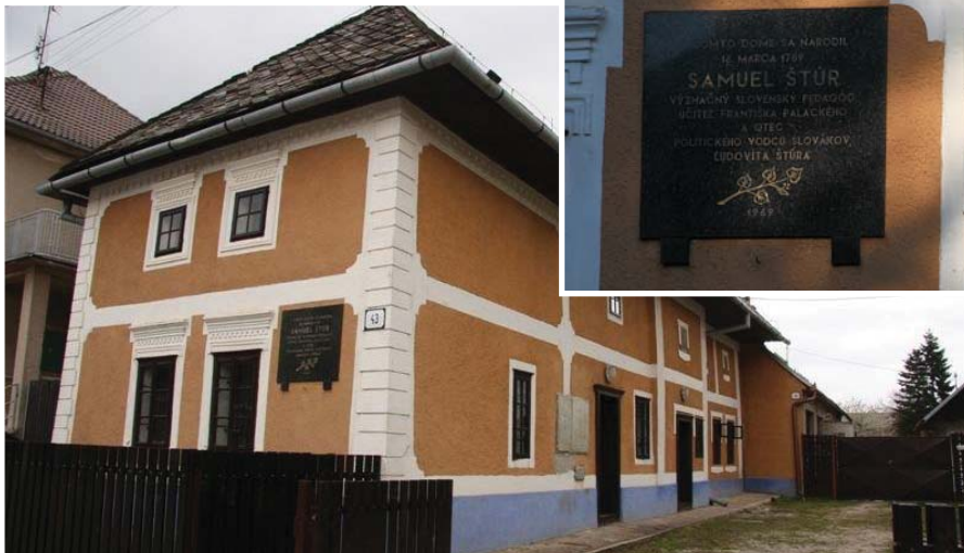
Múzeum Rodný dom S. Štúra

Lubinská škola nesie meno Samuela Štúra a v priestoroch rodného domu je i Lubinské múzeum.