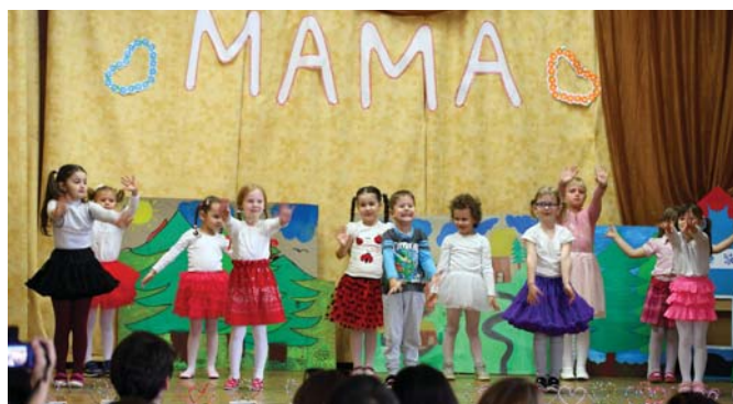
Dievčence z MŠ S. Štúra Lubina

nie je v poriadku, vtedy nám zavolá, opýta sa na to a my sa nestíhame čudovať, ako prišla na niečo, čo sme nikdy nahlas nevyšlovili. Mama to jednoducho cíti, stačí keď nás pohladká a nám sa zrazu uľaví.. No v živote príde aj obdobie, kedy ona potrebuje nás... príde čas, keď nás čaká kedy sa objavíme v