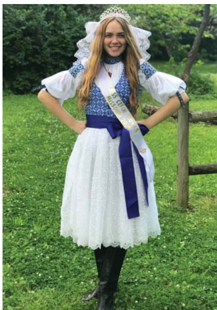
Náš kroj v USA

Veľmi sa mi páčilo, ako si so spolužiakmi z rôznych kútov sveta vymieňame poznatky o našej rodnej kultúre a dostalo sa mi veľa nadšených reakcií na rozprávanie o kopaničiach. Je škoda, že si veľa ľudí u nás doma neuvedomuje, že máme tradície, ktoré by nám vo svete mohli závidieť, a tak som začala písať články na internetovú stránku kopanice.sk , aby sa k nim dostalo čo najviac čitateľov