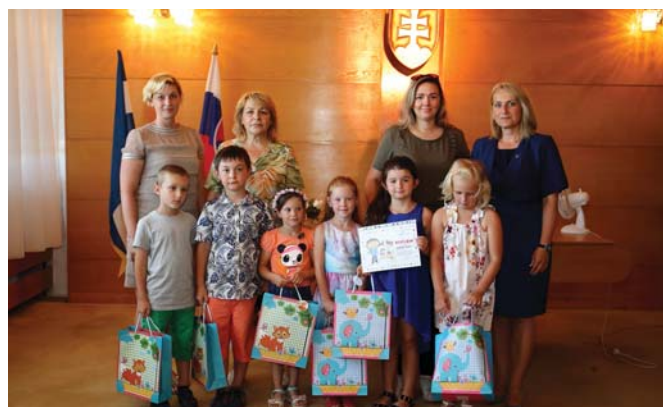
Škôlka - spoločná fotka + rozlúčka