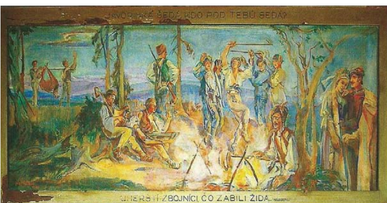
Obraz Uh. zbojníci