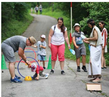
Balajovci v akcii...