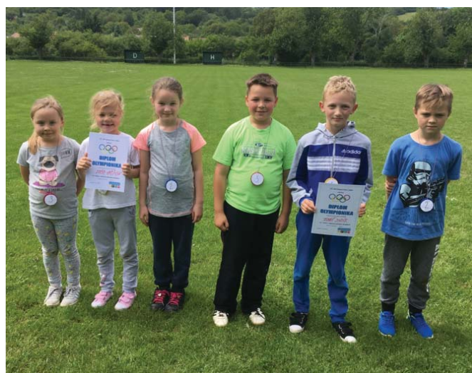
Vítazi v kategórii Hviezdičiek

V druhej časti predpoludnia sa konala športová olympiáda – žiaci boli rozdelení do 4 kategórií podľa veku a každá kategória mala predpísané disciplíny, ktoré museli žiaci absolvovať. Ešte