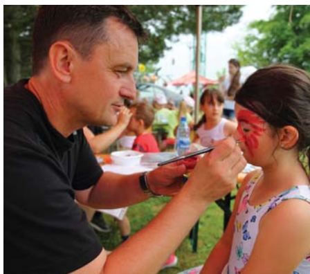
Nechýbalo ani maľovanie na tvár