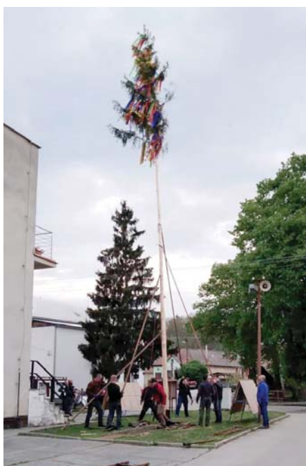
Stavanie mája Lubina-obec