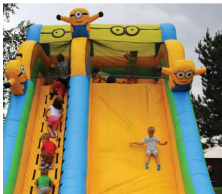
To bolo radosti