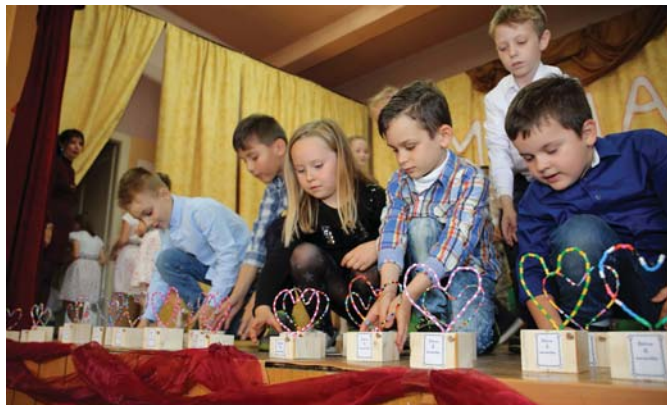
Darček pre každú maminku

Druhá májová nedeľa už tradične patrí všetkým mamám. Byť mamou je určite najkrajšie povolanie v živote každej ženy. Deň matiek je časom, kedy by sme mali povedať našim mamám ako ich máme radi, čo pre nás znamenajú a vyjadrili im našu úctu a vďačnosť za všetko, čo pre nás urobili a stále robia.