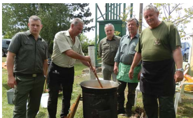
Poľovnícky guláš PZ Roh Lubina