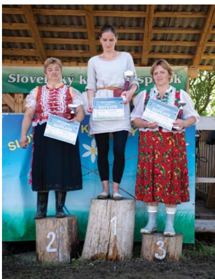
moje tri duracelky

jaké sú súťažné podmienky/kritéria)? Velkost polička, dzeci, ženy 5x5, chlapi 5x10, rýchlost, kvalita, kto jako pokosí – volakto to len „požuje“ alebo vidzet po nom, že neny poránno pokosené – idú trestné sekundy, a potom aj šaty, kto je jako oblečený. Kroj a tak, je to o tom, aby sa vytáhli aj ty ludové šaty. Máme v pravillách, že chlapi nesmú byt hore bez (any baby ☺). Neny prízvukované, že mosá byt v ludovém kroji, ale vítame to.