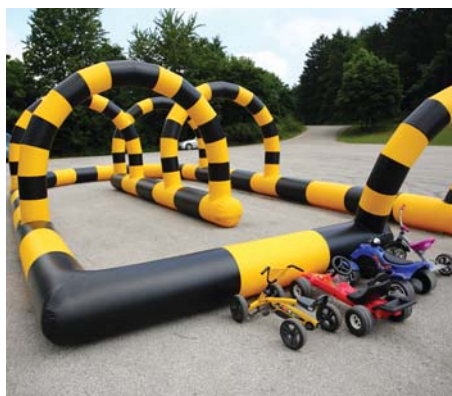
Boli aj motorčky