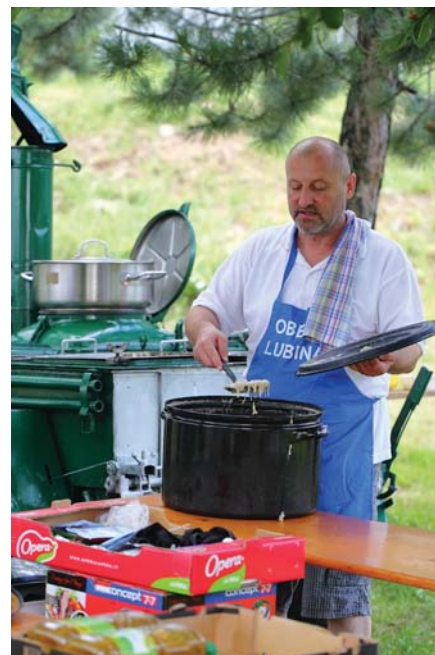
Aj výborné papiňičko bolo...