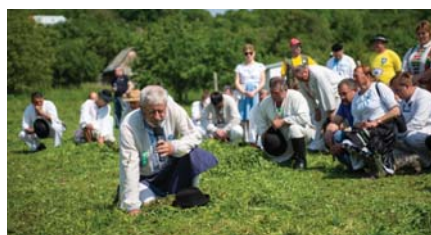
modlidba k tráve

Ščil v Šariši (8.–9. jún) sme neboli, 15. ideme na Malú Vrbku na Morave, tot za roh, zešlý týden bol tata v Čechách, v Orlicách, v Orlických horách. Tak sa mu tam zalúbilo, že zostal cez noc a išel na druhý den kosit do Polska, vykosil si zlato, má doma plyšového medvídka. Volačo má na bruchu napísané po polsky Dalšú nedzelu (16.) ideme do Tatranskej Lomnice, Ostrý Grún pri Žarnovici, na konci júna je Šariš – Ľubovec. Nesúťažne sa kosá horské lúky v Nolčove pri Martine, tam sa ide pátek večer, trošku sa zabaví, o polnoci sa zaspieva naša hymna „Na Kráfovej holi“, vačšinu sa tak do trečie pije, potom sa ide spat a o štvrte sa stává, lebo sa kosí za rosy. O ósmej už je šetko pokosené.