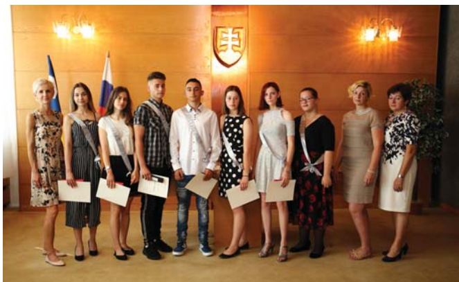
9. ročník a zázpis z rozlúčky žiakov