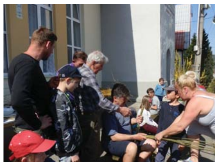
Dobrá rada stojí groš