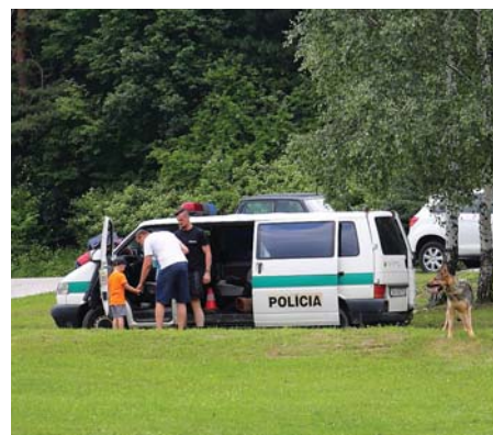
Aj psíčkovia sa prišli predviesť..