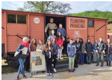
Legiovlak v Brezovej pod Bradlom

A blížime sa k cieľu.. K akému? Koniec školského roka je metou, ktorú chceme úspešne zložiť, a preto v týchto dňoch úročíme všetko, do čoho sme investovali. Na konci školského roka chcú žiaci získať to najlepšie hodnotenie a odniesť si vysvedčenie plné jednotiek. Preto je v tomto čase opakovanie tematických celkov a učiva v jednotlivých predmetoch na dennom poriadku, aby si deti oživilí svoje vedomosti. Popri tom všetko stíhame vyučovací proces dopĺňať a oživovať exkurziami – 2.5. naši najstarší žiaci ôsmeho a deviateho ročníka navštívili