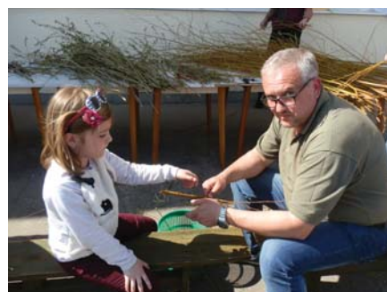
Otec s dcérkou