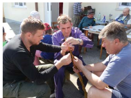
Domorodec s chalupárom a cezpoľným