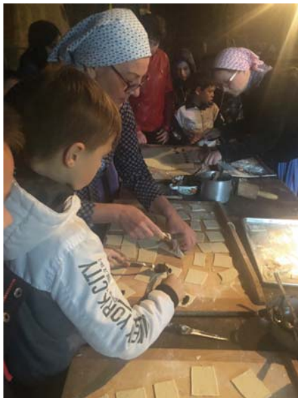
Gazdovský dvor Turá Lúka – príprava lekárových perkov