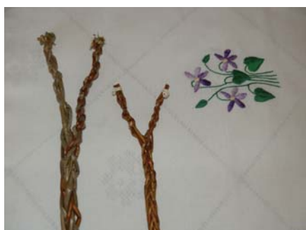
Lubinský korbáč má rúčku a dve uši