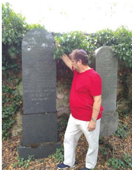
Na židovskom cintoríne v Seredi