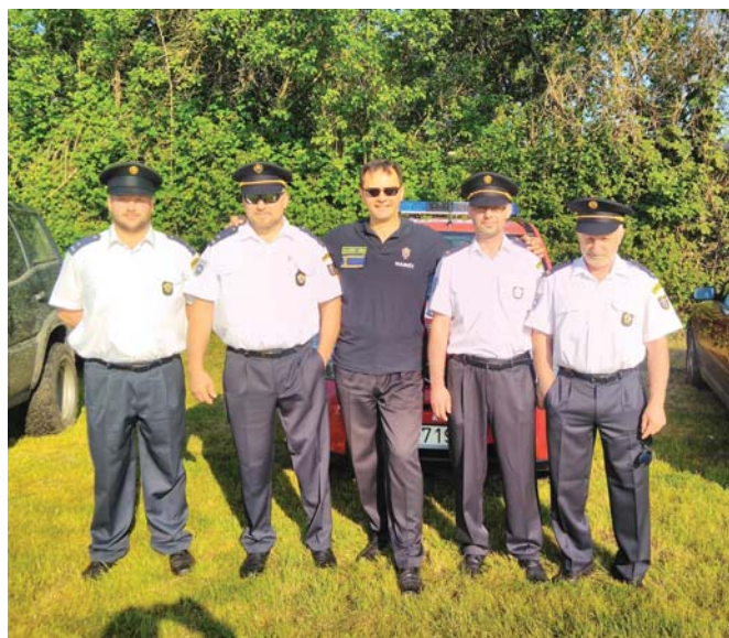
DHZ Miškech Dedinka

Naši dobrovoľní hasiči sa okrem iného venujú aj ukázkam svojej činnosti pre našich najmenších. Nebolo tomu inak ani v tomto roku. V dňoch 24. a 25. mája 2019 predviedli svoje