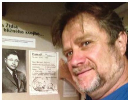
Otec a syn