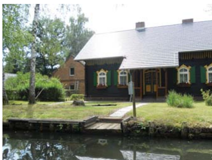
Typický dom Lužických Srbov

Naším cieľom boli najzaujímavejšie kultúrne pamiatky -- Zwinger a Frauenkirche. Žiaľ, Zwinger, palác umeleckých diel a vzácných zbierok, bol zatvorený (navštívili sme ho na predchádzajúcich zájazdoch), tak sme našu pozornosť upriamili na luteránsky Frauenkirche – Kostol Matky Božej . Chrám bol zničený pri bombardovaní Drážďan vo februári 1945. Ruiny kostola spolu so zvyškami kameňov boli ponechané v centre mesta ďalších 45 rokov. Krátko po skončení 2. svetovej vojny sa začalo s číslovaním a konzervovaním zvyšných kameňov a trosiek. Rekonštrukcia trvala veľmi dlho a znova vysvätený bol až 30. októbra 2005. Kostol je majestátny zvonku a krásny zvnútra!. Do výšky 67 m sa dá vystúpiť po 198 schodoch, odkiaľ je panoramatický výhľad na celé mesto. Bol to pre mňa povznášajúci pocit a neodradili ma od prehliadky