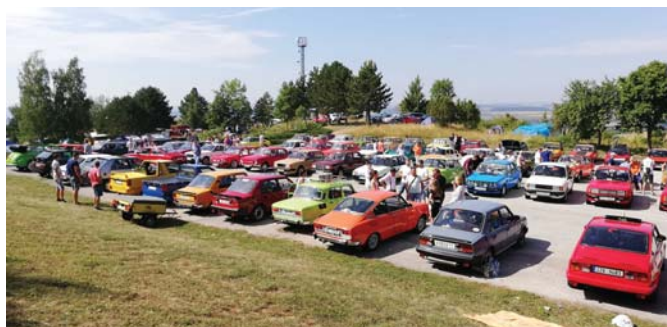
Pohľad na parkovisko pri amfiteátri

Pokračovalo sa v sobotu hlavným programom, kde po uvítaní účastníci začali jazdou AOS, čo je orientačná automobilová