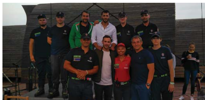
DHZ a Oteckovia

No ani v roku 2019 hasiči z Miškech Dedinky nijako nezaostávajú v ich dobrovoľnej hasičskej činnosti. K dnešnému dňu vykonali množstvo protipožiarnych asistenčných hliadok, medzi ktorými môžeme spomenúť protipožiarnu asistenčnú hliadku v Elster s.r.o. Stará Turá (13. 2. 2019), na vrchu Roh pri príležitosti Podjavorinských folklórnych slávností (11. 5. 2019), na Lubinskej kose (25. 5. 2019), na Chríbe pri príležitosti spomienky na upálenie Jána Husa (4. 7. 2019), na tohtoročnej Traktoriáde ktorá sa konala 6. 7. 2019. Zatiaľ poslednými v tomto roku boli protipožiarne asistenčné hliadky na Rohu pri príležitosti koncertu kapely Desmod (27. 7. 2019), na Veľkej Javorine, pri každoročnom Stretnutí bratov Čechov a Slovákov (28. 7. 2019) a opäť na Rohu na 7. ročníku CS zrazu automobilov Škoda (9. a 10. 8. 2019).