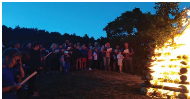
Spievanie hymnickej piesne Kto za pravdu horí

V ten večer, horeli vatry po celom kraji. Pálili sa vatry v dedine i na kopicaniach a rozprávalo sa o živote Jána Husa, o význame husitskej tradície. Žiaľ, dnes už v širokom okolí po dlhé roky horí len tá naša, na Chríbe. Sama, opustená, ale horí ako symbol veľkého úsilia a boja našich predkov o vieru a náboženskú slobodu. A zato, že táto tradícia u nás pretrváva ďakujeme všetkým z MOS v Miškech Dedinke, pretože vynakladajú nemalé úsilie na to, aby sa lubinské tradície zachovávali, všetci návštevníci tu, na Chríbe, dobre cítili a prežili pekný letný večer“.