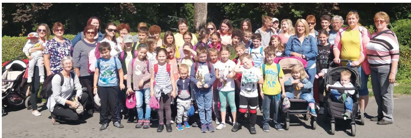
Výlet v ZOO Lešná