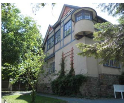
Vila D. Jurkoviča

Bol to vydarený zájazd v spoločnosti príjemných a empatických ľudí. Veľa sme videli a tešili sme sa zo všetkého, čo sme zažili. Už roky cestujeme po Európe – po stopách histórie, na krásne turistické miesta. Tie poznatky a zážitky obohacujú náš vnútorný svet a to je naše trvalé bohatstvo o ktoré nás nikto a nič nepripraví.