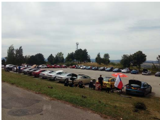
Parkovisko - 406 coupe SK&CZ zraz

bola skupinka monitorovaná a kontrolovaná dvomi kamerami ktorým sekundoval aj dron, aby sa presne zmapoval každý ich pohyb a nikto z civilov nebol v nebezpečí. Večer po príchode tridsiatich áut a ubytovaní sa v penzióne ROH nasledoval príhovor a poďakovanie zúčastneným, ktorí precestovali