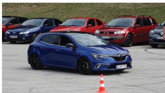
Megane v akcii

Sobota, hlavný zrazový deň sme začali o 10.00 hod. slalomom zameraným na presnosť a precíznosť šoférovania - pohár s vodou nemohol počas slalomu opustiť strechu vozidla.