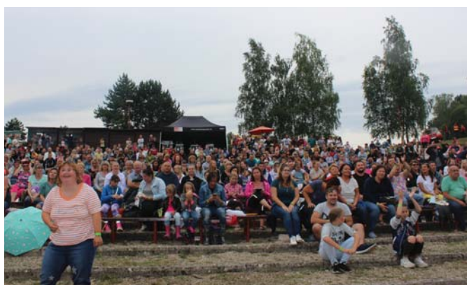
Pohľad do publika