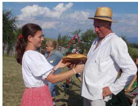
Chlebiček pre gazdu