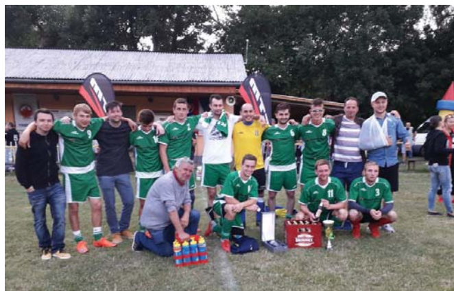
Vítazné družstvo FC Stráni

Poďakovanie patrí všetkým sponzorom, zúčastneným, družstvám, rozhodcom a hlavne organizátorom, ktorí pripravili toto pekné športové nedeľné podujatie. Organizátori sa už dnes tešia na 58. ročník.