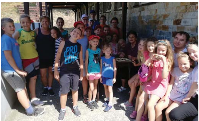
Spoločná aj s kuchárom