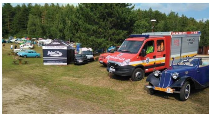
DHZ a CS Škoda zraz