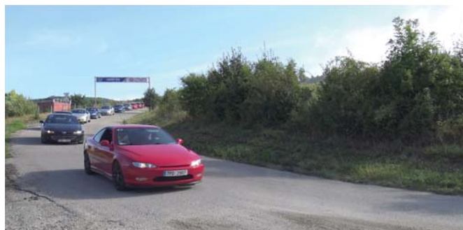
Jazda z Rohu