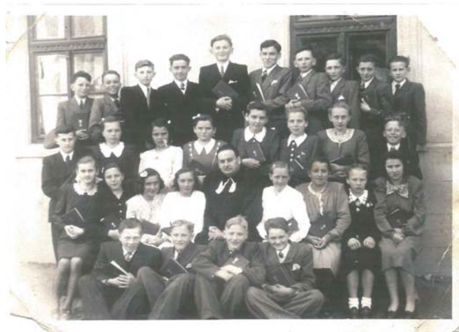
Konfirmanti CZ ECAV Lubina 1948

Záverom chcem povedať, že tak ako to je v živote každého človeka aj u mňa bolo obdobie, keď viera nebola dostatočná z rôznych príčin, ale posledných 36 rokov hlavne po zoznámení sa s manželkou došlo k tomu, že viera, láska a rodinný život sa stali prioritné v mojom živote. Mám radosť, že náš cirkevný zbor najmä v poslednom čase pod vedením brata farára a sestry farárky nám dáva širokú možnosť duchovného pôsobenia. Je na moju škodu, že v poslednom čase sa zo zdravotných dôvodov nemôžem zúčastňovať podujatí v priebehu týždňa na ktorých sme sa s manželkou pravidelne zúčastňovali.