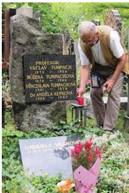
Na hrobe G. Vránovej