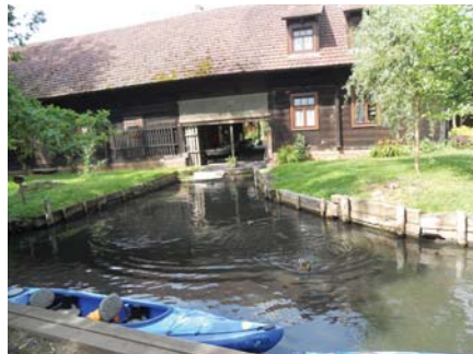
Na rieke Spréve

Lužickí Srbi sú najmenší slovanský národ. Žijú v Nemecku v povodí horného toku rieky Sprévy. Sú to potomkovia Polabských Slovanov, ktorí sa ubránili germanizácii. Obývajú územie Lužice, ktoré je časťou nemeckých spolkových krajín Sasko a Brandenbursko. Žije ich tu takmer sto tisíc, najmä v okolí miest Bautzen a Cottbus. Zachovali si svoje tradície, zvyky, kroje, sú dvojazyční (lužická srbčina a nemčina). Po náboženskej stránke sú Lužickí Srbi rozdelení na dve skupiny -- časť vyznáva rímskokatolícke náboženstvo a časť patrí k evanjelickej cirkvi augsburského vyznania. Po vzniku zjednoteného Nemecka im ústava zaručuje všetky ľudské a občianske práva.