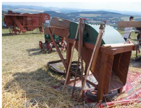
Geplovica, vzadu malá mlátička

Vytrácajú sa znovu a zas z narodených z tých po nás naboso bez ponôz z časopriestoru koscov-kôs, čo býval čulý, v ktorom kosy si kuli, rojili sa ako včely v úli v rytme sprava doľava, v ktorom sa raž ľahko zdoláva. Na konci polí, cítiaci chleba vôňu, ako o kríž opreli sa oň a o ňu, o krehké kúzlo kosy, ktoré koscov nosí.