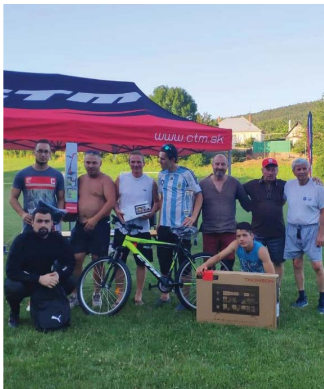
Vítazi jedenástok pod Javorinou