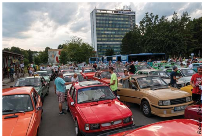
Škodovky na Starej Turěj

Cetunu a späť na Roh. Súťaže AOS sa dokonca zúčastnila aj posádka z Hrachovišťa na vozidle Š 120 GLS, ktorej vekový priemer bol cez 70 rokov! Čakanie na výsledky sa vyplnilo hlasovaním za auto zrazu a osobnosť zrazu, dámskou a detskou súťažou. O 17:30 sme sa vybrali na okružnú jazdu cez Starú Turú. Do nálady nám hral DJ Mauricio, ktorému ďakujeme za výbornú atmosféru.