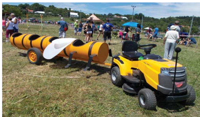
Jazda na včele