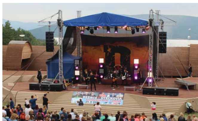
Vystúpenie skupiny DESMOD