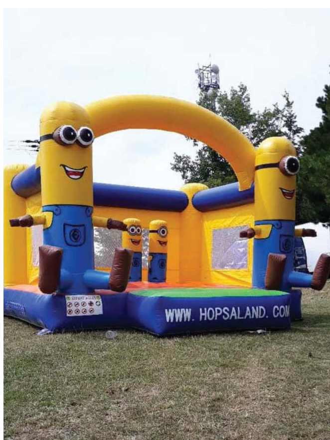
Aj zábava bola

Medzi jednotlivými časťami programu boli pre deti pripravené súťaže a animačný program s lesnou vílou Lilou. Vrcholom programu bolo vystúpenie obľúbenej detskej skupiny PACI PAC. Hudobníci roztancovali celý amfiteáter a deti sa s nimi iba ťažko lúčili.