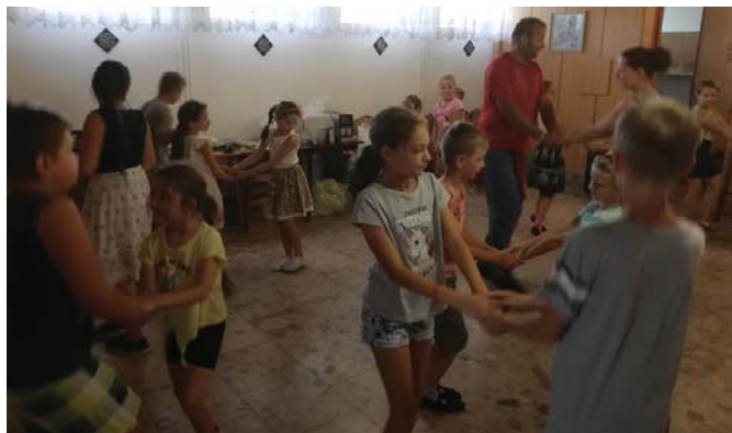
Tanec s Miňom

Tak ako minulý rok, tak aj tento sme sa rozhodli usporiadať detský folklórny tábor pre detičky z DFS Javorinka, ale aj nefolklórne deti. Bola som prekvapená, že sa nám prihlásilo raz toľko detí ako minule.