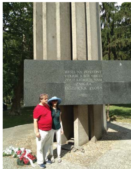
Pomník obetiam holocaustu v Seredi