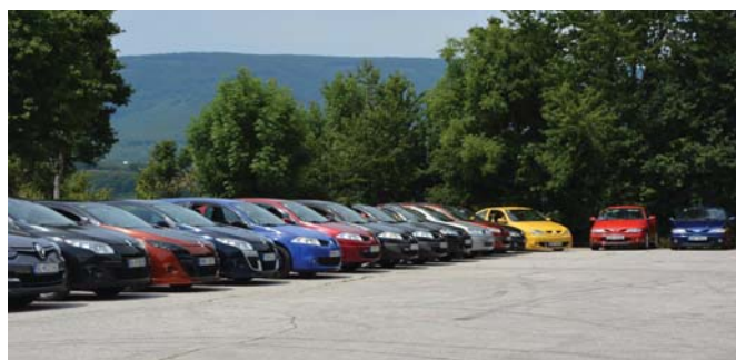
Pohľad na auta na parkovisku

Slávnostné vyhodnotenie ako aj odovzdanie trofejí