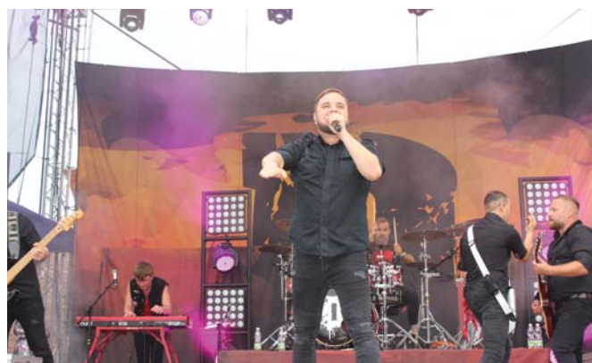
Kuly v akcii