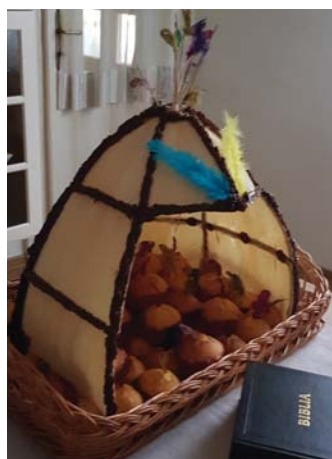
Indiánsky stan tee-pee

naš cirkevný zbor. Tohtoročná téma sa niesla v hľadani Veľkého indiánskeho pokladu. Cieľom letného tábora bolo tľmočiť deťom posolstvo, že najväčším pokladom pre indiánov nebola truhlica s diamantmi ukrytá niekde v jaskyni na brehu jazera. Tým najväčším pokladom bol Pán Ježiš Kristus – Boží Syn. Práve On sa stal najväčším pokladom pre mnohých Indiánov z viacerých Indiánskych kmeňov. Každodenné témy