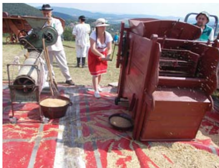
Vpavo rajtar, vľavo čistička