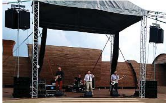
Vystúpenie skupiny VIDIEK

Spomienkové oslavy organizovala obec Lubina s OO SZPB v NMnV, v spolupráci s Trenčianskym osvetovým strediskom a s finančnou podporou Trenčianskeho samosprávneho kraja.