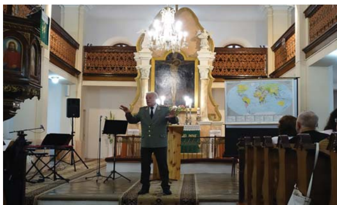
Návšteva Lubina 2019

Štefánik vždy vedel, čo chce a išiel za svojím cieľom. Miloval nadovšetko svoj národ, túžil vydobýť pre neho slobodu a uznanie vo svete. Stálo ho to veľa odriekania, hladovania, štúdia, skúmania, bádania a vyjednávania s vtedajšími politickými mocnosťami. Nebolo to vždy ľahké, ale on sa nebál