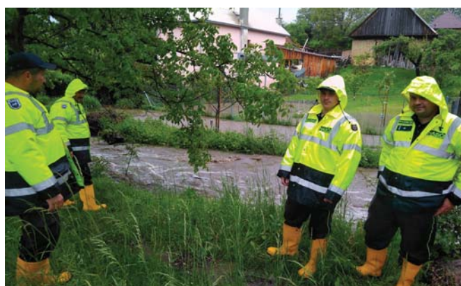
DHZ v akcii

umenie deťom pri príležitosti ich medzinárodného dňa vo firme Elster s.r.o. v Starej Turej. Prvý deň sa hasičskému umeniu a technike prizerali prváčikovia zo staroturanských škôl a druhý deň patrilo deťom zamestnancov firmy Elster s.r.o. Ukážky pre deti z detských táborov sa konali na vrchu Roh, kde boli tieto deti ubytované. Najprv to boli deti z tábora z obce Tomášov