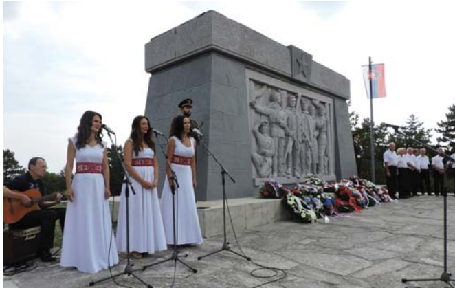
Folklorná spevácka skupina Krajka a mužský spevácky zbor z Brezovej pod Bradlom

Na záver zaznela hymnická pieseň a spomienková slávnosť