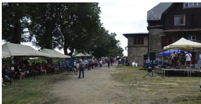
Holubyho chata a malé pódium