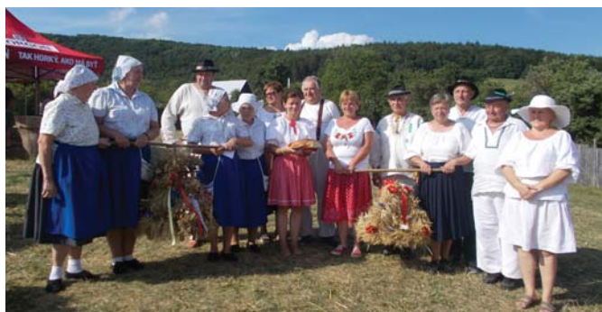
Odozdávanie dožinkových vencov a chlebička gazdovi