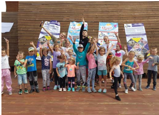
Spokojné detičky na festivale

O to pripravenejší sa všetci zainteresovaní prichystali na nedeľné ráno. Najdôležitejšou časťou festivalu bol program na pódiu, kde sa striedali samí talentovaní hudobníci, tanečníci či športovci.