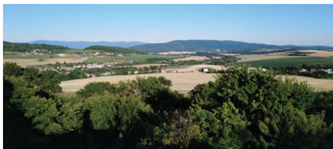
Výhľad z Chríbu