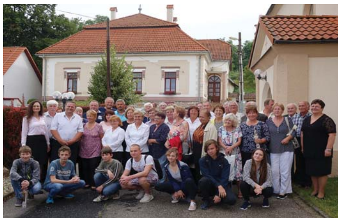
Návšteva Lubina 2019

V nej Taliansko uznalo vytvorenie Československej armády v Taliansku (légie) ako autonómnu súčasť Československej národnej rady a tiež uznalo Československo ako budúci štát. Aj 24. máj 1918 bol veľmi dôležitým dňom pre Štefánika, keď na Piazza Venezia pri oltári vlasti odovzdali zástavu československým legionárom. V ten deň Štefánika pre jeho prejav označovali za „kráľa Ríma“.