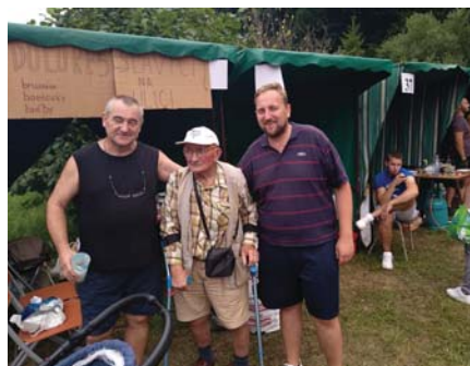
Slávici na ulici

Za 10 rokov Podkozinskú varešku navštívilo 290 súťažných družstiev. Len za posledné 4 roky sa varilo 901kg mäsa a 438 kg cibule. Tento rok to bolo „iba“ 207 kg mäsa a 115 kg cibule. Prevažovali guláše hovädzie (132 kg mäsa), danielie (16 kg mäsa), srnčie (7 kg mäsa). S nižším číslom sa objavili guláše jelenie, diviačo-jelenie, jahňacie, hovädzie, hovädzo-bravčové, bravčové.