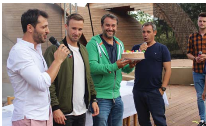
Všetko najlepšie oslávencom