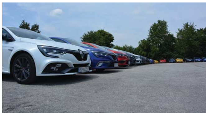
Megane v plnej kráse

Počas slalomu sme varili guláš, ktorým sme sa mohli posilniť