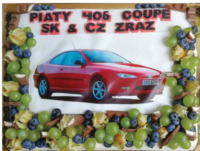
Torta zo zrazu