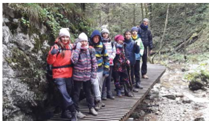
A tiež deti spoznávali krásy nášho

Slovenska. Žiaci 6. ročníka nabalili ruksak, nabrali odvalu a prešli tiesňavu - Jánošíkove diery pri Terchovej. Počasie prialo, nezmkli a jesenná príroda ponúkla svoje čaro. Vidieť, čo dokáže vytvoriť tečúca voda počas svojej tisícročnej práce je neuveriteľné. Navyše si vyskúšali i svoju fyzickú silu a vytrvalosť. Do cieľa došli síce vyčerpaní, no plný zážitkov a neopakovateľných momentov.