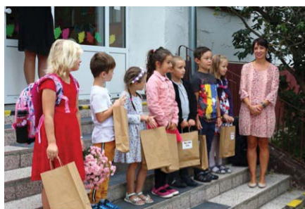
Naši prváci s pani triednou učiteľkou