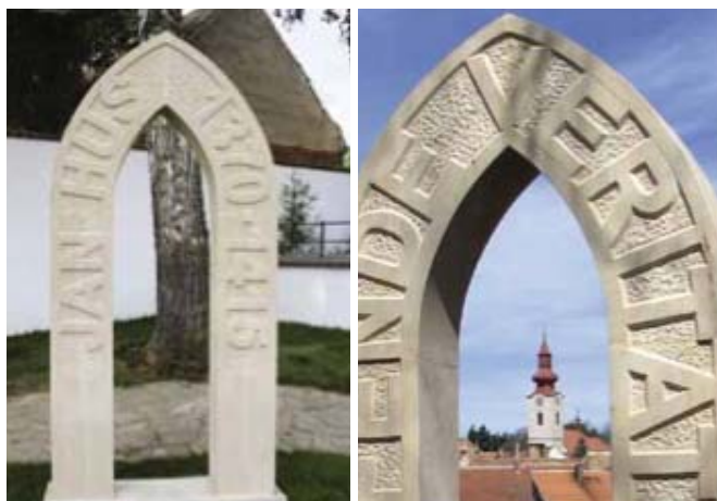
Brána, na ktorej je z druhej strany nápis: „Braňte pravdu“ „Prosím, aby se milovali, dobrých násilím tlačiti nedali a pravdy každému přáli.“ (M. J. Hus, Husovy listy)

Majstra Jana Husa od nás delí šesť storočí. Dnešnému človeku je síce už vzdialená až príliš veľká náboženská viazanosť a horlivosť. Ale aj pre nás je stále aktuálna hodnota pravdy,