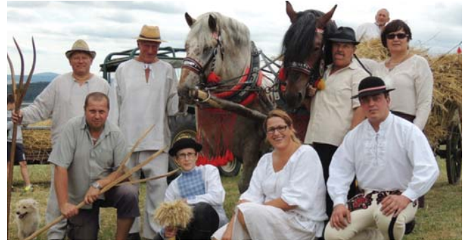
Žatva v 2017