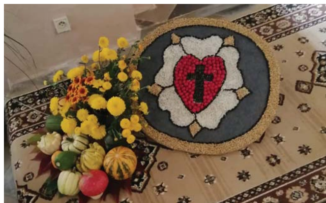
Lutherova ruža zo semienok

Túto skutočnosť žalmista vyjadruje zvláštnym obrazom: „ mladosť tvoja sa obnovuje ako orol. “ Prečo orol? Za orlom sa skrýva obraz bájneho vtáka Fénixa. Táto bájka pochádzala z Egypta, ale bola všeobecne známa. Vták Fénix žije 500 rokov, a potom sa spáli na hranici. Z popola však povstane omladený k novému životu. Kresťania v starej cirkvi prevzali tento obraz ako symbol ukrižovaného a vzkrieseného Ježiša Krista. Mladosť je časom i obrazom otvorenej budúcnosti. Nech máš koľkokoľvek rokov, vedz, že Boh má pre teba dobrú budúcnosť. Toto všetko nás nielen povzbudzuje, ale zároveň umožňuje dobrorečiť Hospodinovi, a to aj vtedy, keď sa nám zdá, že slnko je skryté za mrakmi. A tak nás Boh učí, aby sme Mu vždy dobrorečili, či je jasno alebo zamačené, či máme dostatok každodenného chleba alebo nie, pretože všetko, čo nám pripravil, On pevne drží vo svojich rukách. Pri návšteve jednej rodiny upútal moju pozornosť obraz s názvom: Domáce požehnanie. Stáli tam tieto slová: Kde je viera, tam je láska. Kde je láska, tam je pokoj. Kde je pokoj, tam je požehnanie. Kde je požehnanie, tam je Boh. A kde je Boh, tam je všetko. Nech je našim každodenným spoločníkom Pán Boh. Verte mi, je to správna voľba. Voľba pre vieru, lásku, pokoj a Božie požehnanie. Voľba pre vďačnosť. Voľba pre život v závislosti na Bohu a Jeho daroch.