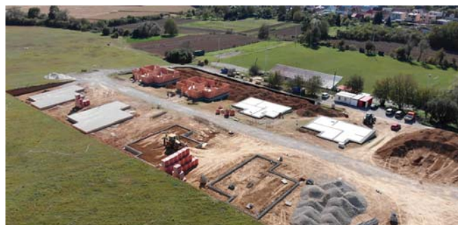
Pohľad na výstavbu