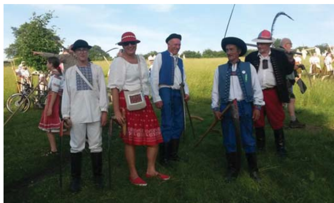
Malá Vrbka, 2019

Obíjali sme čelo stodoly drevom a ujec nám doviezol laty, aj nám pomáhal zatĺkať. Nevie, ako sa to zbehlo, našiel