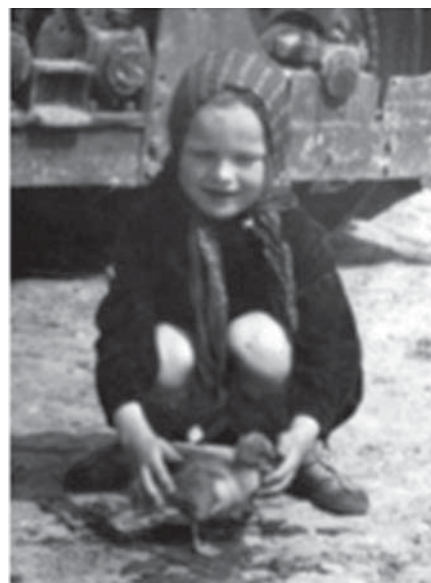
... o 4 roky neskôr so svojou ďalšou veľkou láskou - “čaptavou” husičkou.

Po dvore sa potulovalo už len moje veľké milované húsa. Vedela som, že jej osud je už spečatený a bolo mi ho veľmi ľúto. Ale ľúto mi bolo aj môjho veľkého brata, ktorý nemohol prísť na hody domov a ochutnať svoju obľúbenú lahôdku. I keď bol odo mňa o 13 rokov starší, bol medzi nami krásny súrodenecký vzťah. Stále okolo mňa obletoval, so všetkým mi vždy pomáhal, kadečo mi kupoval...staral sa o mňa priam otcovsky. Mala som