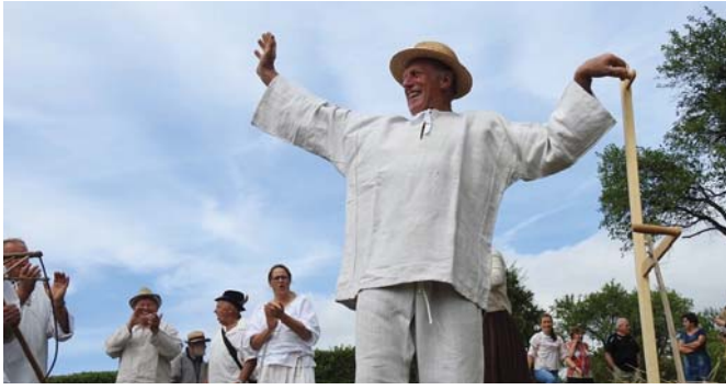
2017 dokosil ako posledný