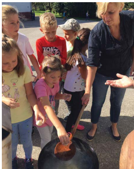
...a šup s nimi do kotlinky...

V septembri sa venujeme tradícii prípravy regionálneho jedla z plodov našich záhrad. Tento rok sme sa zamerali na babičkinu kuchyňu, ako inak, všetci ju zbožňujeme. Zvolili sme slivky – a z nich sú predsa výborné slivkové gule. Poprosili sme tety