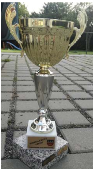
Jarkov putovný pohár, 2019

Ďakujem vám, Jarko a Ivka, za milý rozhovor, prajem vám obom úspešný školský rok, prijatie na ďalšie štúdium a veľa radosti z kosenia a z florbalu! A aby sa vám furt na našich Kopianicách ľúbilo!