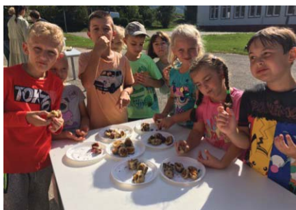
...sú výýýbornééé !...

kuchárky, aby nám v predstihu uvarili zemiaky v šupke, a to ostatné už deti za asistencie pani učiteľiek zvládli. Postup si isto zapamätali, zemiaky treba ošúpať, nastrúhať, pridáme hladkú múku a vypracujeme cesto. Pre lepšiu chuť ho troška osolíme a zabalíme doň očistenú slivku. Vyzerá to jednoducho, no pre detské ručičky celkom zaujímavá práca, lebo cesto je lepkavé, guľky sú nepravidelné. Nič to, vyvarili sme ich v kotlinke priamo na školskom dvore a posypané makom či opraženou strúhankou chutili výborne! A bolo ich toľko, že mohli ponúknuť i starších spolužiakov.