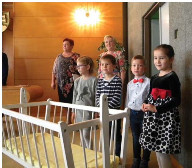
Deti z materskej škôlky Lubina