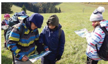
Hlavne sa nestratiť!