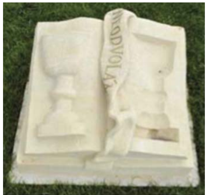
Kniha, na ktorej stojí celé kresťanstvo; „Zákon Kristův či zákon Boží je vyjádren v Písme svatém.“ (M. J. Hus, O postačiteľnosti Kristova zákona)

Žijeme síce v odlišnej dobe a iných životných podmienkach, ale aj pre nás zostáva zachovaná dôležitosť duchovných a etických hodnôt, ktoré Jan Hus zastával a zdôrazňoval.