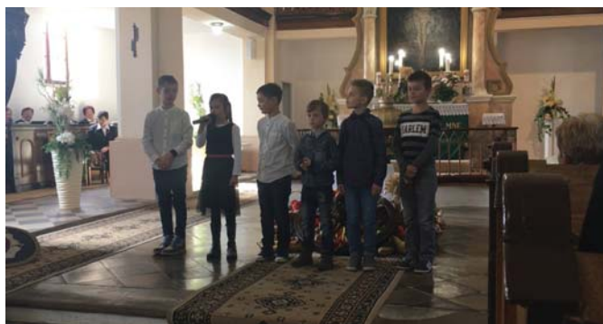
Výstupenie detí v kostole