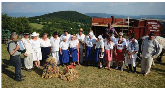
Po žatve 2019-pekný pohľad na Lipovec