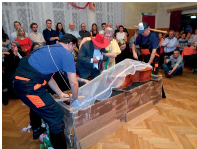
Hrobári v akcii