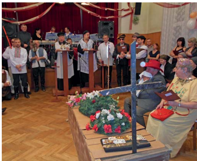
Dočasne pochovaná basa

O výbornú náladu sa svojim humorným programom postarali členovia FS Javorinka v scénkach: