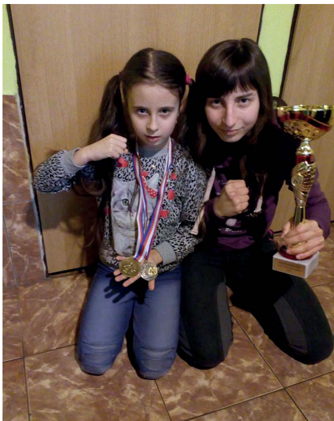
So sestrou Simonetkou

Máš svojho vlastného trénera, alebo si členkou nejakého klubu?