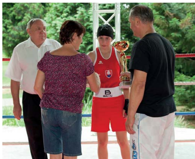
„Odmena“ za víťazstvo