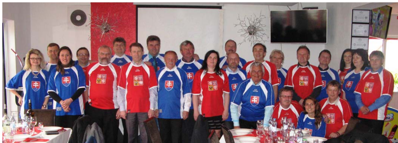
Spoločná fotografia časti členov javorinského výboru v hokejových dresoch v národných farbách.

Odbornými garantmi programu slávností sú Trenčianske osvetové stredisko a Klub kultúry Uherské Hradiště. Výbor privítal nových členov výboru pre obce a mestá, kde sa po voľbách udiali zmeny na postoch starostov a primátorov a ich zástupcov.