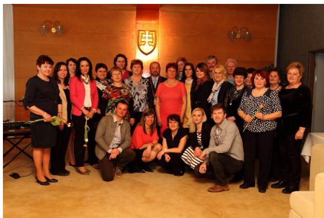
Kolektív učiteľov a nepedagogických zamestnancov ZŠ s MŠ S. Štúra Lubina s vedením obce