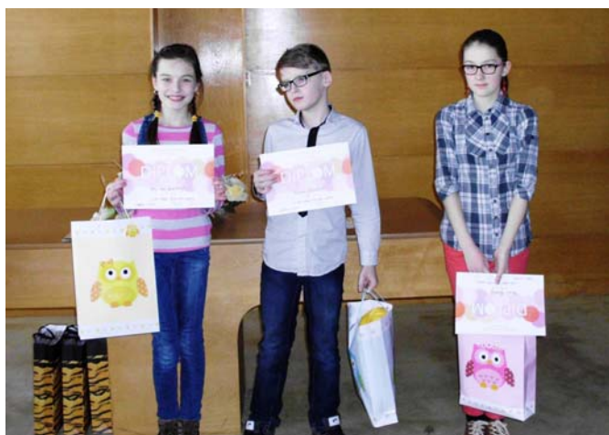
Vítazi 1. kategórie

Žiaci 7. - 9. ročníka sa v II. kategórii predviedli po krátkej prestávke a oberstvení. Konkurencia bola veľká. Každý súťa-