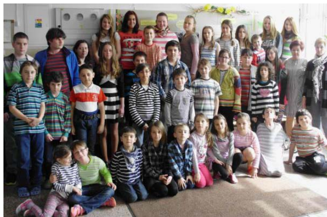
Deň v „pásikoch“

Asi každý z nás sa po dlhej zime teší na prvé teplé jaré lú e, na prebúdzenie sa prírody, ke sa všetko zazelenie a rozkvitne. Deti v škole sa tiež tešili na jar a prejavili to vo farebnom, veselom a nápaditom „Týždni jarnej módy“. Od pondelka 23.3. do 27.3. sme sa obliekali pod a ur ených vzorov na jednotlivé dni v týždni. V škole zavládla pravá jará nálada a nadšenci pre módné trendy si prišli na svoje. Témou v oble ení a doplnkoch boli bodky, kvety, pásiky, zvieracie vzory a piatok sme zav šili v elegantnom oble ení. Žiaci aj u telia sa s každou témou vyhrali a dali si záleža aj na detailoch a drobných doplnkoch. Cie om tejto myšlienky bolo podporova fantáziu, tvorivos , utužova vz ahy v kolektíve, ale aktivita mala aj eduka ný charakter. O každej téme a módných trendoch si žiaci vypo uli rozhlasovú reláciu a mali možnos zapoji sa do vedomostného kvízu.