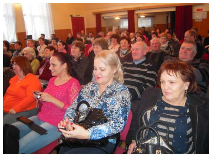
Pohľad na prevažnú časť prítomných.