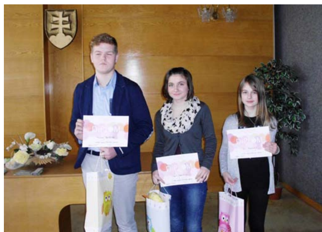
Vítazi 2. kategórie