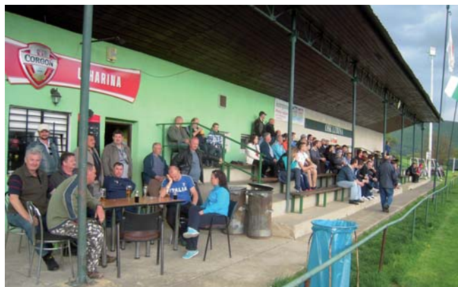
Pohľad na spokojných fanúšikov v Lubine počas zápasu Lubina – Stará Lehota.

hráči robia na smeny (12 hod.) a tréningov sa nemôžu pravidelne zúčastniť, čo sa odzrkadľuje i na výkonnosti celého kolektívu. Družstvo trpí nedostatkom hráčov a niektorí sú iba do počtu, ba pre niektorých sú prednejšie sobotňajšie nočné sedenia ako nedeľňajší futbal. Niektorí hráči si vôbec neuvedomujú, že futbal nehrajú pre funkcionárov, ale v prvom rade pre seba a fanúšikov. Pevne veríme, že v družstve nastane zvrát a hráči sa budú snažiť dosiahnuť čo najlepšie výsledky, keď ich cieľom je skončiť do 4. miesta, čo by pri súčasnom kádri bolo úspechom.“