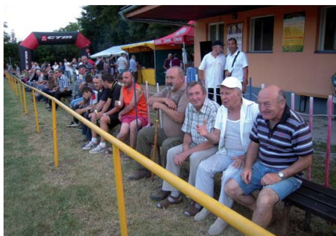
Pohľad na fanúšikov počas vlaňajšieho turnaja na ihrisku TJ Lubina kopanice (Hrnčiarové).