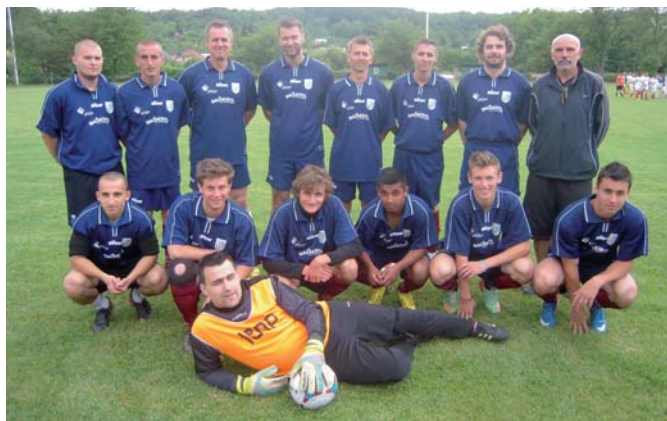
PŠK Bzince pod Javorinou