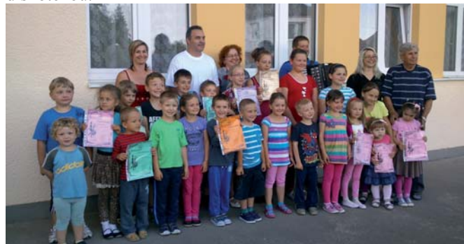
Foto: ukončenie školského roku DFS Javorinka

Ukončenie školského roku v príprave detí FS Javorinka. Deti boli odmenené folklórnym vysvedčením a sladkými odmenami. Vyučovacia hodina sa ukončila javorinkárskou hymnou – „Z hory veter veje“, javorinkárskym pokrikom a detskou diskotékou.