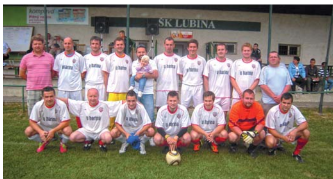
Družstvo domáceho OŠK Lubina