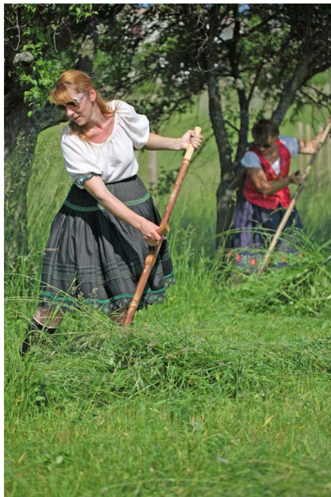
Ani ženy sa nenechali zahanbiť