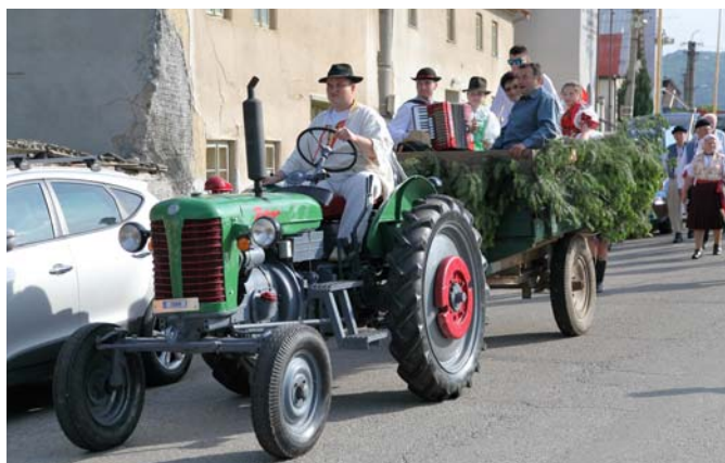
Za kosbou na poriadnom „tátošovi“