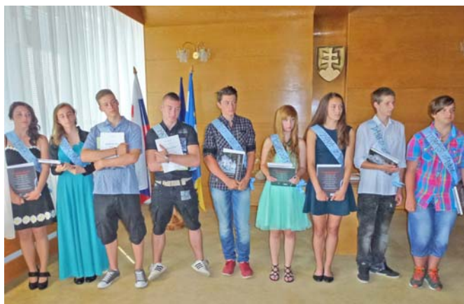
Rozlúčka so žiakmi 9.A

Na záver chcem všetkým spolupracovníkom, žiakom, rodičom poďakovať za zdarný a úspešný priebeh tohto školského roka. Za spoluprácu, aktívnu účasť a záujem o dianie v našej škole. Cením si každý záujem, otázku, návrhy na riešenie a možnosti tvorby nových plánov do budúcnosti. Želám Vám krásne leto plné oddychových a zároveň dobíjajúcich zážitkov!