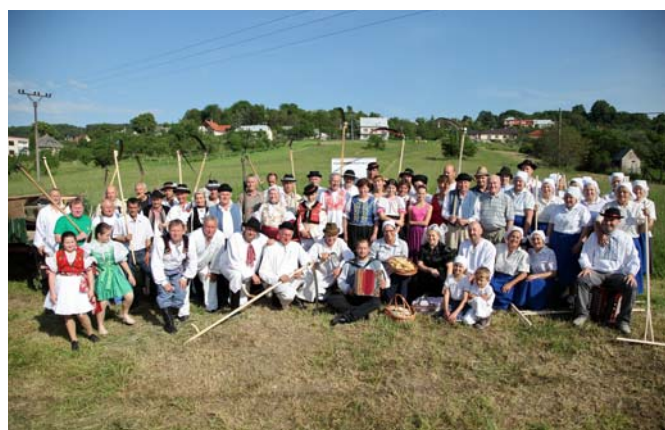
A ešte spoločná fotografia zúčastnených