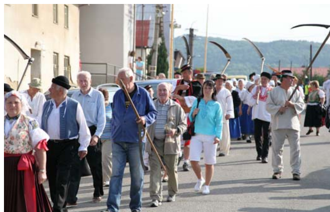
Za kosbou aj po vlastných