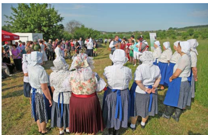
Po poriadnej kosbe si treba aj poriadne zanôtiť