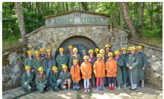
Pred vstupom do banskej štôlny Andrej pri Kremnici

nosti netrpezlivá, plná očakávaní. Stretla som ľudí, na ktorých nikdy nezabudnem. Možno si to neuvedomili, ale každý mi daroval kúsok seba. Musím sa usmievať, keď spomeniem, ako sme my - malí prváci stáli prvýkrát na školských schodoch. Neverím, že dnes je to už za nami, prišiel koniec našej cesty. Vo mne zostanú spomienky navždy, budem ich uchovávať ako najdrahšie poklady a nenastane chvíľa, kedy zabudnem.