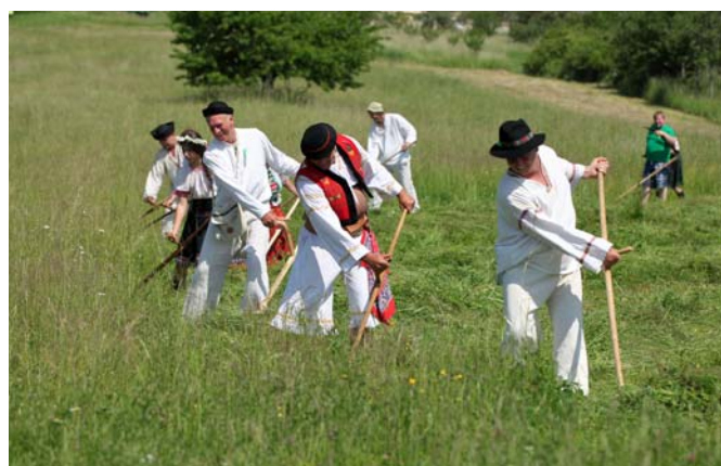
Kosenie v plnom prúde