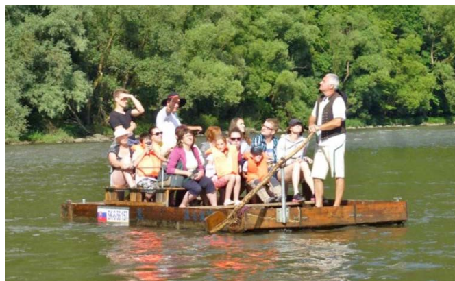
Splavovanie Váhu na plti

Niektorí využili možnosť vyvieť sa sedačkovou lanovkou strediska Park Snow Donovaly na najvyšší vrch a odtiaľ sa kochať nádhernými výhľadmi na panorámu Veľkej Fatry a Starohorských vrchov, medzi ktorými sa toto stredisko nachádza. Navečer sme sa vrátili do krajského mesta – Banskej Bystrice a absolvovali prehliadku historickým centrom so sprievodným výkladom. Už len chutná večera, ubytovanie a oddych. Na druhý deň sme sa dostali do geografického stredu Slovenska, mesta Kremnica. Obohatili sme sa poznatkami výroby a razby mincí, navštívili Mestský hrad a kostol sv. Alžbety. Ktorým zostalo trochu energie, vystúpili po točítých schodoch na miestnu vyhlídkovú vežu a spoznávali panoramatické okolie mesta. Ako inak, je to banské mesto, a tak sme sa dostali i do neďalekej štôlne Andrej. S prilbou na hlave, v ochrannom plášti sme prešli hlavnú trasu štôlne a vypočuli si historiky z ťažkého života baníkov v minulosti. Horúci slnečný deň sme trávili relaxačne, kúpaním v Holiday Park v Kováčovej. Nedeľu sme venovali návštevu pamätníka SNP – dominante Banskej Bystrice. Cestu domov sme obohatili tu-