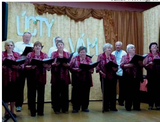
Dolinka z Hrušového

„Opýtala som sa babičky na jej detstvo: „Mala som ho krásne, hoci sme žili skromne. Od jari do zimy sme boli stále vonku. Hrali sme sa, či bolo pekne, pršalo, snežilo. Hrali sme sa s loptou škôlku. Najlepšie bolo, keď sa mlátilo obilie, všade som musela byť. Skákali sme v slame, a keď sa nám podarilo padnúť do pliev, to pichalo! V zime sme mali správnú sanicu u nás v humne. Na potoku sme sa šmykali a korčuľovali, nemala som žiadne oteplováky, len pančuchy a tepláky. Veľakrát sa nám ľad prelomil a boli sme celí mokri. Z teplákov som mala cencúle, ale domov som nešla. Neboli by ma pustili von. Večer mama navarila lipový čaj a nohy som si musela močiť v lavóri. Nemali sme televízory ani počítače, no napriek tomu sme žili šťastne a tešili sme sa z každej maličkosti. “