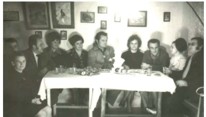
Stretnutie aktérov do roku 1984