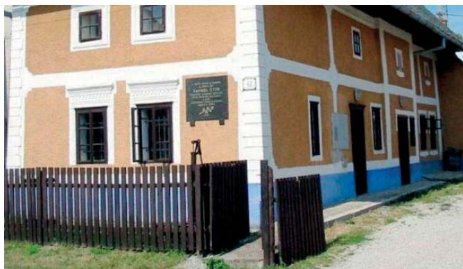
Múzeum Rodný dom Sameula Štúra