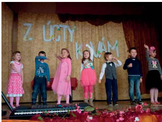
Program v podaní škôlkarov

„Moja babina svoje detstvo strávila doma, pretože škôlka ešte nebola. Hrávala sa s textilnou bábikou, ktorú vozila v prútenom košíku. Do školy nastúpila na Hrnčiarovom, kde chodila po štvrtú triedu. Svoj voľný čas trávila s kamarátkami rôznymi hrami a vozením sa na bicykli. S babinou bývame spolu v jednom dome a tak sa vidíme každý deň. Veľmi rada lúšti krížovky, číta, zapája sa do rôznych súťaží, ktoré sú v novinách a počúva hudbu, ktorá jej dáva chuť do života. Rada spoznáva krásy Slovenska. “