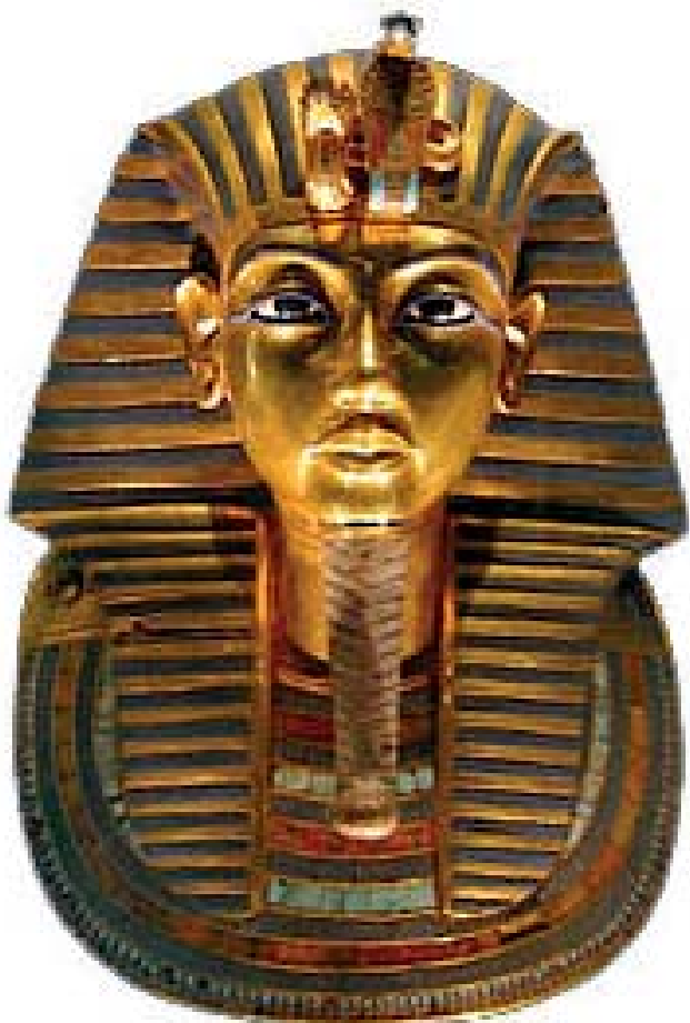
Tutanchamónova pohrebná maska

zomrel prirodzenou alebo násilnou smrťou.