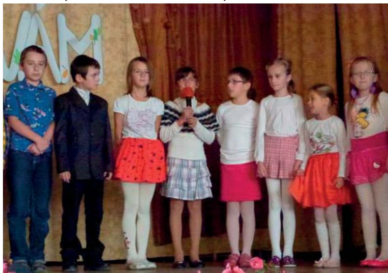
S pekným programom vystúpili deti zo základnej školy

„Keď bola moja starká malá, nepoznala také veci, ako my. Nemala mobil, nesedela pri počítači alebo pri televízii, hrávala sa guľičky, škôlku, loptové hry, zbierala servítky, pohľadnice, známky... Jedávali veľa strukovín, kysnuté koláče, mali