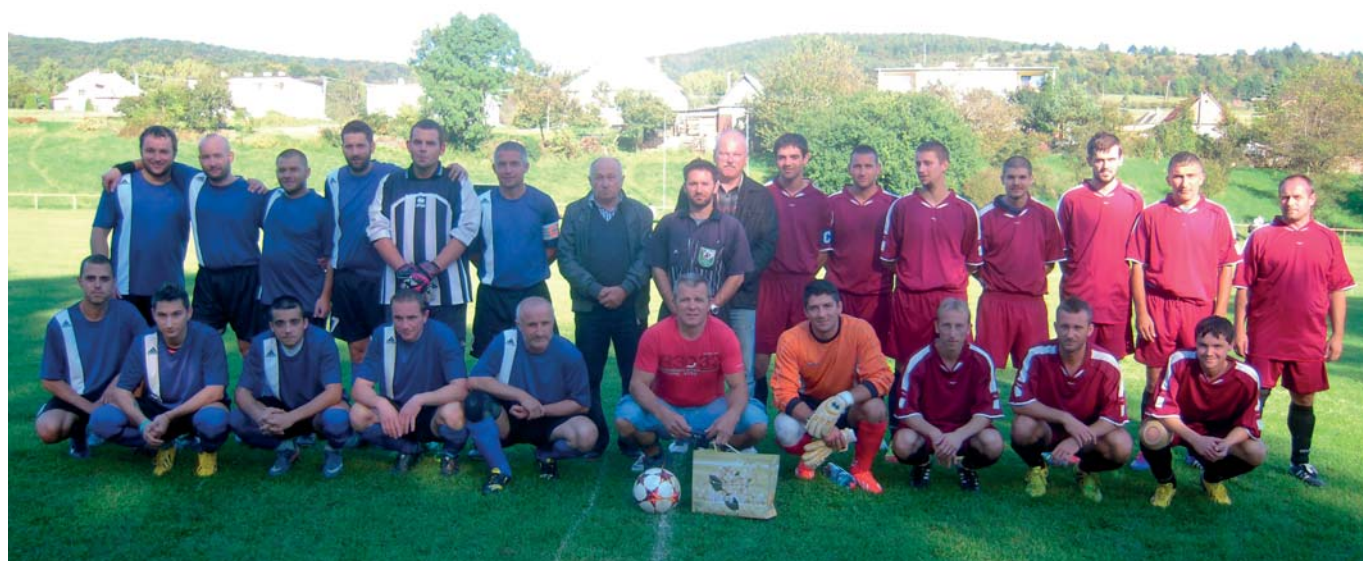
Vľavo TJ Lubina kopanice, vpravo TJ Štart Svinná