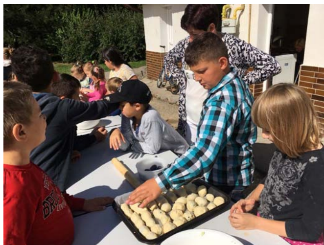
Príprava domácich slivkových koblih

Ako každý rok, začali sme návikom civilnej obrany. Po skúšobnom vyhlásení poplachu a spoločnom nástupe sa žiaci II. stupňa prakticky vzdelávali v oblastiach brannej výchovy (zdravotná príprava, orientácia v teréne, použitie ochranných prostriedkov civilnej obrany, evakuačná batožina) a následne si tieto vedomosti overili v teste. Žiaci I. stupňa využili čas na návštevu pamätníka bojovníkov SNP v osade Náracie (Stará Turá). Začiatok septembra venujeme práci v kuchyni s využitím jesenných plodov. Tento krát sme zvolili slivky. „Koblihovanie“ – že o čo ide? Piekli sme spoločne slivkové koblihy. Jedno cesto zemiakové, jedno kysnuté. Vymiesiť, slivky očistiť, zabaliť do cesta, na plech a upiecť. A čo sme si upiekli, to sme si aj zjedli. Boli výborné!