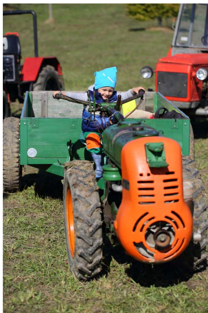
Malý Matej – darmo, má to pevne v rukách.

Nie všetci prítomní traktoristi súťažili. Niektorí sa prišli totiž „výlučne“ popýšiť a tak bolo možné obdivovať napr. najväčší traktor Kirovec vo vlastníctve pána Žáka z Jablonky. Celko-