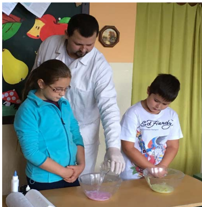
Výroba domácej plastelíny

Škola hrou a chémiou. Zaujímavé spojenie. Chemická show – ako bolo nazvané demonštračné predstavenie, ukázalo deťom, že chémia je bežná súčasť nášho každodenného života. Žiaci dostali návod ako si vyrobiť „sloniú pastu“ alebo plastelínu z bežných domácich surovín. Tiež boli poučení o tom, že existujú nebezpečné plyny, ktoré v kombinácii s kyslíkom a zápalnou iskrou vybuchnú.