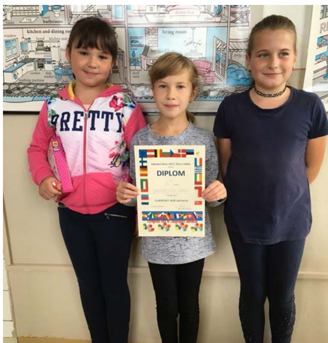
Európsky deň jazykov a Víťazné družstvo žiakov I. stupňa

Európsky deň jazykov – 26. 9. „Koľko jazykov vieš, toľkokrát si človekom“. I to bolo motívom pripraviť žiakom školskú súťaž. Rôzna obtiažnosť v jednotlivých ročníkoch, rôzna forma otázok a zadaní, veľa z nich hrovou a zaujímavou formou.