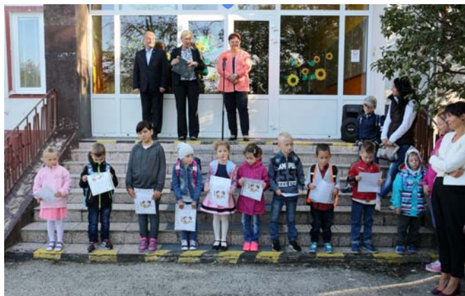
Otvorenie školského roka 2017 – 2018

A tak sme sa na túto cestu vzdelávaním vydali. Školský rok sme slávnostne otvorili v pondelok 4. septembra 2017. Najviac sa určite tešili naši najmenší žiaci, ktorí do školských lavíc sadali po prvý krát. Bol to pre nich vzácny deň, určite zostane nezabudnuteľným. Osobne ich privítala pani riaditeľka i pán starosta s milým darčekom.