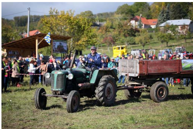
Skúsený pán traktorista.