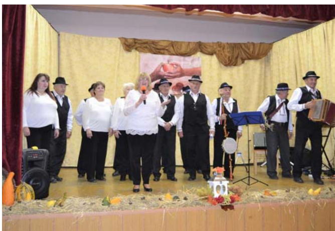
Spevácka skupina Bukovčané z Bukovca. Zábava zaručená.