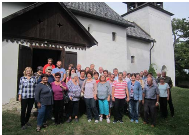
Spoločná fotografia pred kostolom v Kyjaticiach.

Kyjatice majú v súčasnosti 84 obyvateľov. V celom regióne sa prejavuje veľká depopulácia.