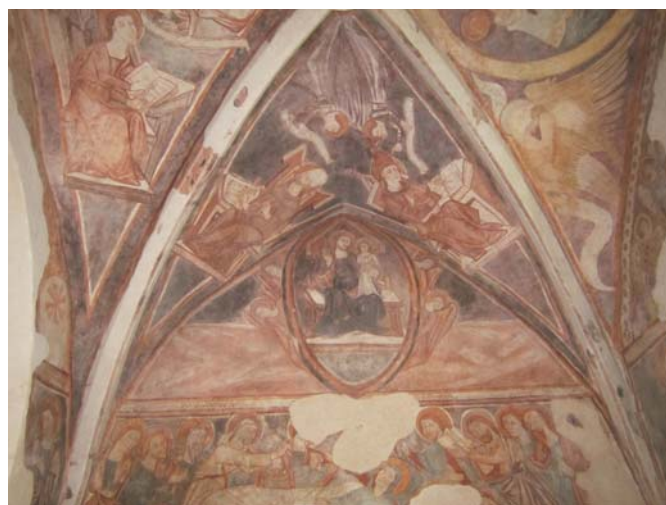
Gotické fresky z kostola v Rimavskom Brezove