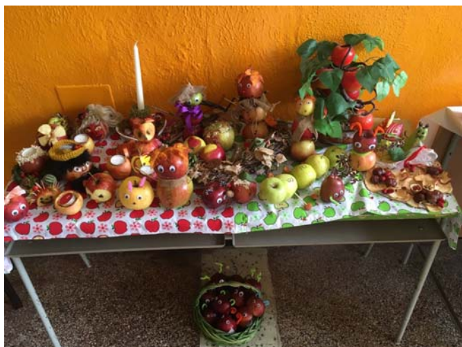
Jablková výstavka vo vestibule školy