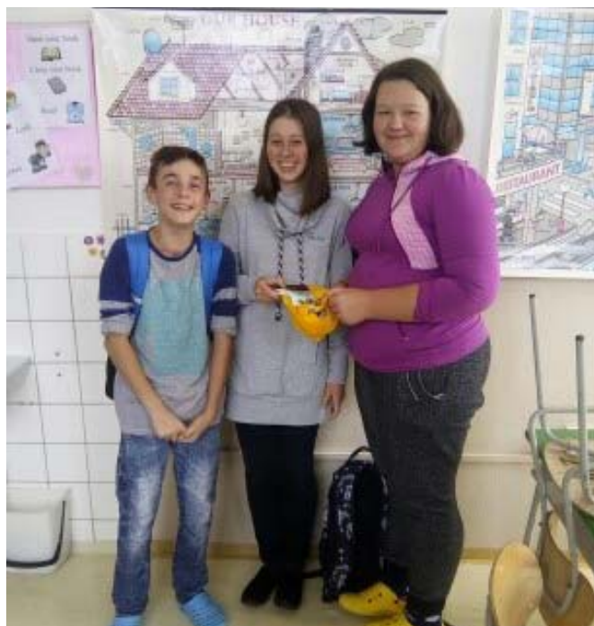
Európsky deň jazykov a Víťazné družstvo žiakov II. stupňa

Škola hrou a chémiou. Zaujímavé spojenie. Chemická show – ako bolo nazvané demonštračné predstavenie, ukázalo deťom, že chémia je bežná súčasť nášho každodenného života. Žiaci dostali návod ako si vyrobiť „sloniú pastu“ alebo plastelínu z bežných domácich surovín. Tiež boli poučení o tom, že existujú nebezpečné plyny, ktoré v kombinácii s kyslíkom a zápalnou iskrou vybuchnú.