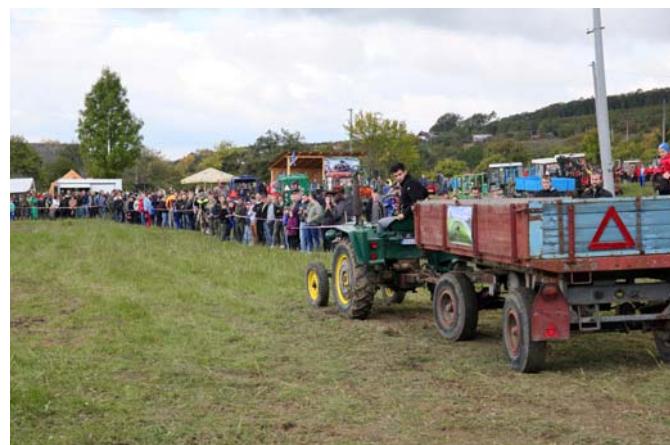
Súťažné zápolenie. Aký mám čas?