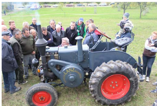
Ale nakúkajú. Našiel sa niekto, koho tento „tátoš“ neupútal?