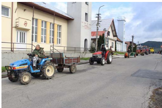
Časť defilé štvorkolesových tátošov.

Defilé asi päťdesiatich traktorov sa spred Osvetového dom Dr. Milana Hodžu v Miškech Dedinke za sprievodu vozidla VB presunulo na lúku U Valenčíkov, ktorá nie tak dávno, bola de- jiskom 2. ročníka v kosení ručnou kosou pod názvom Lubinská kosa. Možno ani sami organizátori nepredpokladali, aká veľká bude účasť. Tá bola bohato zastúpená na oboch stranách – na strane návštevníkov i na strane traktoristov. Niektorí účastníci svoje cesty merali naozaj zďaleka, napr. z takej obce Vitanová na Orave. Najpočetnejšie zastúpenie mal traktor značky Zetor (Zetor 25 v počte kusov 8), a málokto asi vie, že tento rok to bolo už 71 rokov, čo Zetor uzrel svetlo sveta a stal sa tak nena- hraditeľným pomocníkom v poľnohospodárstve.