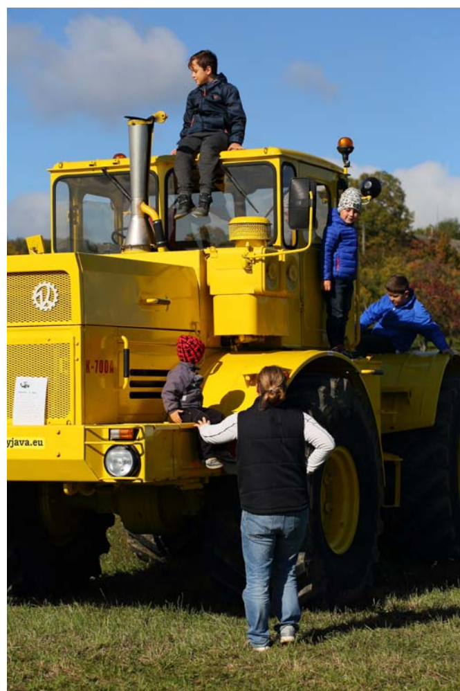
Kirovec nemal ani chvíľu pokoja, stále bol ovešaný deťmi.