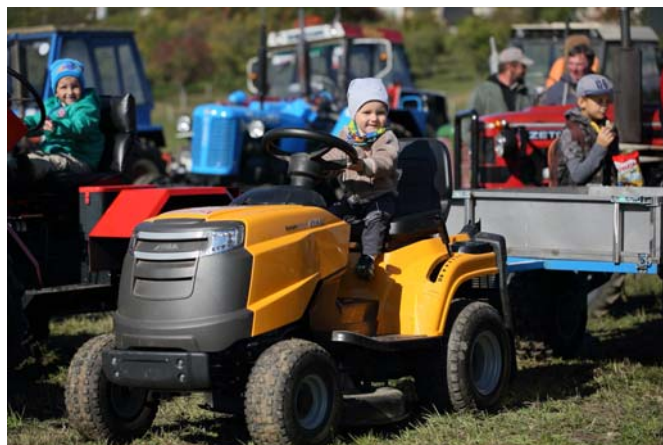
Budúci, alebo už tuaktouisti?