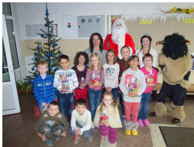
..ďakujeme za sladké prekvapenie..

Čas vianočných sviatkov už klope na dvere. Pokračujeme v tradíciách a hneď prvou je zdobenie vianočného stromčeka. V tomto období máme s deťmi tvorivé dielne, kde sa venujeme tvorbe vianočných ozdôb, pečeniu medovníčkov, zdobeniu medovníkových domčekov. Tento rok sme tvorili vianočné ozdoby z vizovického cesta, ktorými sme ozdobili vianočný stromček vo vestibule školy. V piatok, 5.12. nás v škole navštívil Mikuláš a každého žiaka za peknú báseň, pieseň, dokonca hádanku odmenil sladkým balíčkom. V pondelok