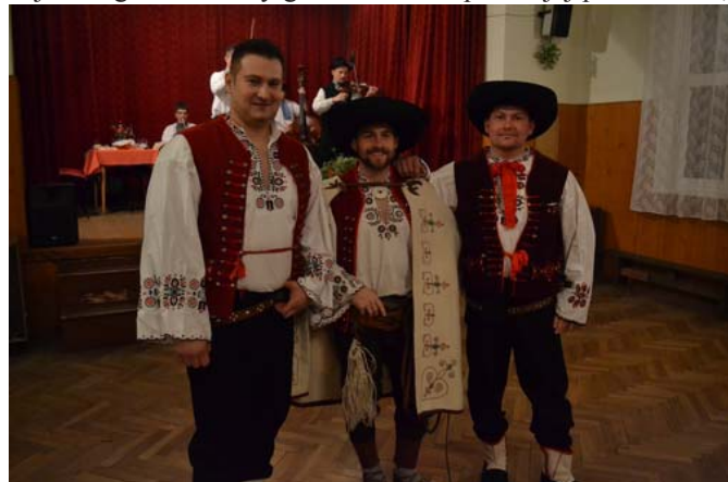
členovia FS Záriečanka zo Záriečia

Neskôr večer začala prebiehať Gazdovská súťaž o najschopnejšieho gazdu. Každý gazda sa môže pri svojej práci vonku,