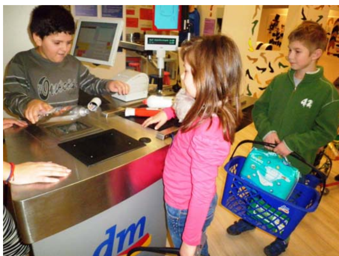
..ako predavač a nakupujúci..