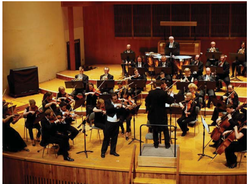
Sólo so Štátnou filharmóniou Košice