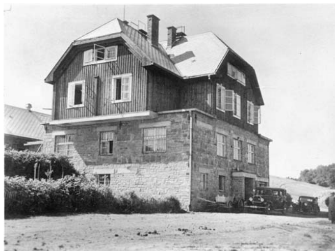
Holubyho chata po válce z roku 1949.

Zálešákovy převáděly ve velkém počtu do roku 1940 a přicházeli k nim lidé z různých končin Čech a Moravy. „Objevovali se denně a přešlo jich přes naši chatu na Javořině přes