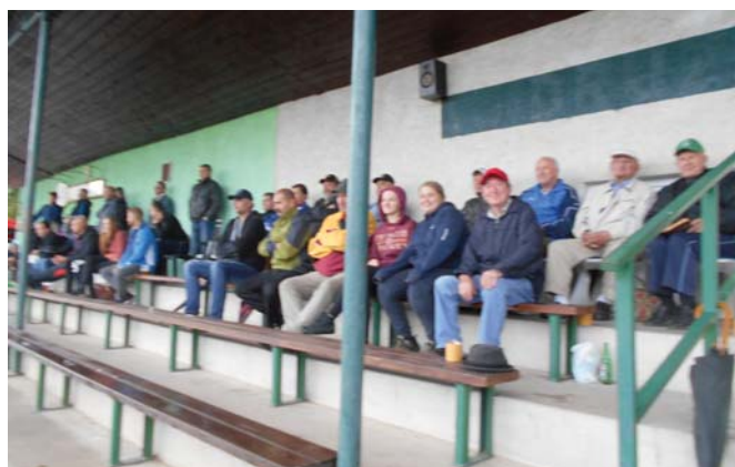
V obecnom derby dňa 17.9.2017 Lubina – Lubina kopanice, títo verní fanúšikovia OŠK Lubina, videli veľa gólových šanci, hlavne svojich hráčov, ktorí nepremenili i 2 pokutové kopy a nakoniec TJ Lubina kopanice zvíťazila 1 : 0 a získala vtedy prvé body.