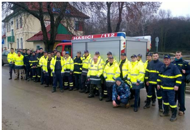
Spolupráca pri hľadaní nezvestnej osoby v katastri mesta Stará Turá

V začiatku kalendárneho roka býva priestor v každom Dobrovoľnom hasičskom zbere (DHZ) na hodnotenie činnosti za uplynulé obdobie. Poslednú januárovú sobotu tomu tak bolo aj v Dobrovoľnom hasičskom zbere Miškech Dedinka. Vo veľmi úzkom kruhu svojich členov a pozvaných hostí v Osvetovom dome Dr. M. Hodžu v Miškech Dedinke hasiči hodnotili rok 2015 a akcie, na ktorých sa podieľali.