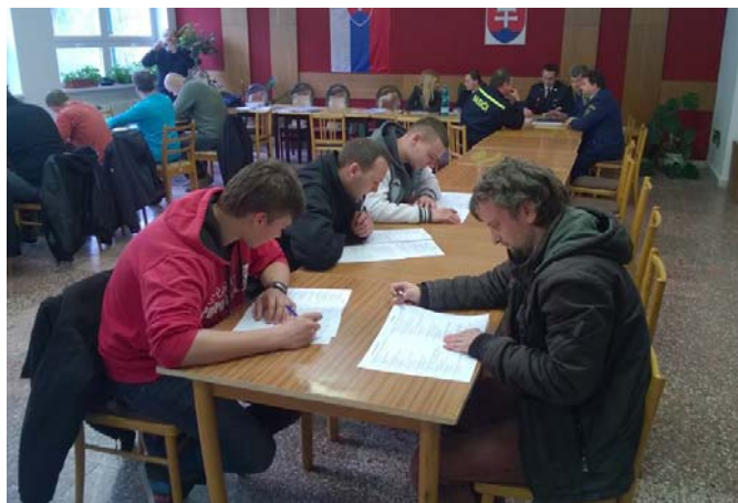
Skúšky k získaniu Odznakov odbornosti 3. a 2. stupňa

Ďalším bodom hodnotiacej správy bola aktivita hasičov na obnove priestorov hasičskej zbrojnice, ktoré majetkovo patria obci Lubina. Vo svojom voľnom čase a za pomoci príspevkov obce Lubina, hasiči vymenili aj druhú vchodovú bránu do garáže, vymenili okná na hasičskej zbrojnici, pravidelne čistili priestor pred, ale aj vo vnútri hasičskej zbrojnice a kosili trávnik. K tomu všetkému sa hasiči starali aj o pridelenú techniku Iveco Daily, požiarnu striekačku, elektrocentrálu, motorovú pílu a iné technické prostriedky potrebné k požiarnemu zásahu. Na to, aby tieto technické prostriedky dokázali úspešne a efektívne zvládnuť, sa hasiči pravidelne vzdelávajú a školia. Na teoretické vzdelávanie sa využilo zimné obdobie a praktické cvičenia vykonávali v letnom období.