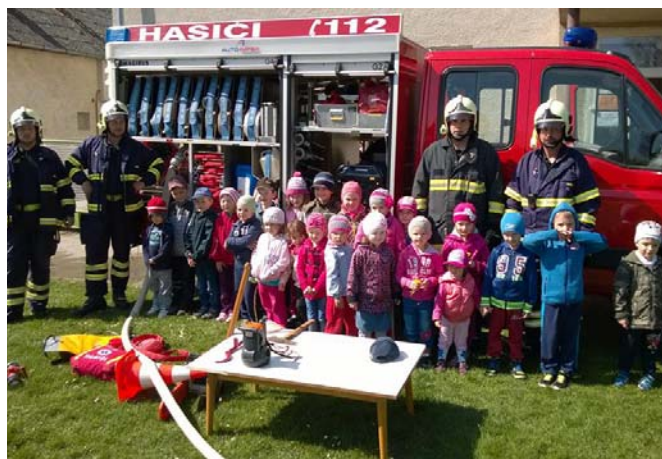
Ukážka techniky, hasenia, technických prostriedkov a OOPP používaných hasičmi pri zásahoch deťom z materskej školy v Lubine

Tradičné stretnutie občanov o 24:00 hod na uliciach na Hrnčiarovom, Miškech Dedinke a osadách na kopaniciach. Tradičné zvonenie na zvonici v Miškech Dedinke na záver roku 2015, uvítanie Nového roka 2016 a vyvesenie štátnej sloven-