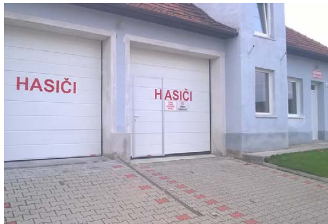
Rekonštrukcia hasičskej zbrojnice – výmena okien a vchodovej brány do garáže

asistenčné hliadky sa vykonali aj na akcii Pálenie majstra Husa na Chribe a na oslavách na Veľkej Javorine. Na týchto akciách sa hasiči podieľali aj pomocou so stavaním stánkov, nosením lavíc a stolov či prípravou amfiteátra.