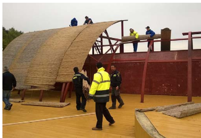
Brigáda na amfiteátri na vrchu Roh Lubina