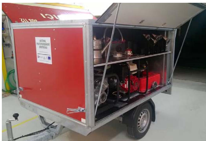
Nové vybavenie DHZ - Špeciálny príviesny vozík s protipovodňovou technikou – odovzdaný v októbri 2015 v rámci projektu Aktívne protipovodňové opatrenia financovaného z Kohézneho fondu prostredníctvom operačného programu Životné prostredie.