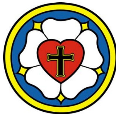
Lutherova ruža – symbol ECAV

Luther usporiadal služby Božie v evanjelickom duchu. Namiesto omše postavil do stredu služieb Božích kázeň slova Božieho v materinskom jazyku a Večeru Pánovu pod spôsobom chleba a vína. Napísal Malý a Veľký katechizmus. Zložil aj niekoľko hlbokých duchovných piesní, z ktorých najznámejšia je naša evanjelická hymna: Hrad prepevný. Ako profesor teológie vychovával v duchu evanjelia budúcich kňazov nielen pre Nemecko, ale aj pre cudzinu. Luther zomrel 18. februára 1546 vo svojom rodisku Eislebene. Jeho telesné pozostatky previezli