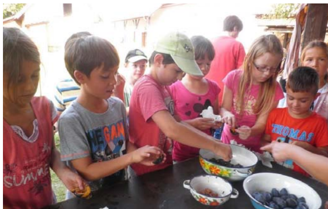
Príprava ingrediencií na varenie slivkového lekváru v Gazdovskom dvore Turá Lúka

Nadchádzajúcim jesenným dňom sme prispôbili i školské aktivity. Využili sme pekné prajné počasie a žiaci I. stupňa navštívili pamätník SNP na vrchu ROH (9. 9. ). Cieľom bolo