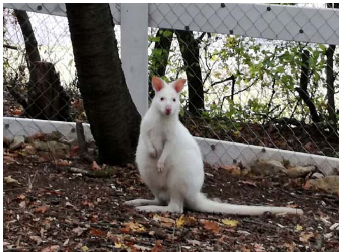
Kengura – albin Joey

K.J.: Hovorí sa, že ak si nájdete prácu, ktorá je zároveň vašim koníčkom, už nikdy nebudete musieť pracovať. ☺ Naša práca nás veľmi baví a naplňa, hlavne kvôli bezprostrednej