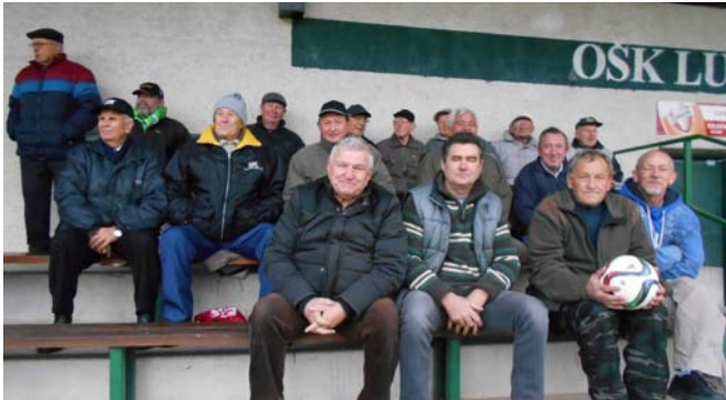
Pohľad na časť spokojných divákov