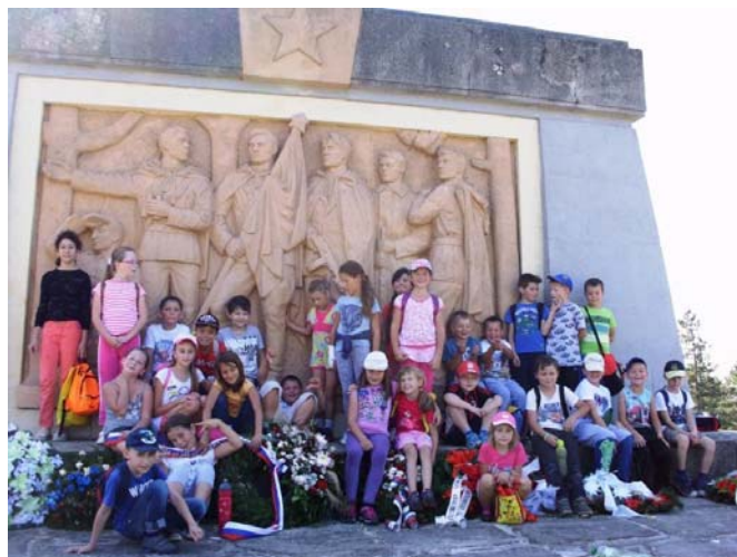
Pri pamätníku SNP na vrchu Roh

lých. Spomeňme si našich najbližších, navštívme miesta ich odpočinku a venujme im pamiatku formou spomienky.