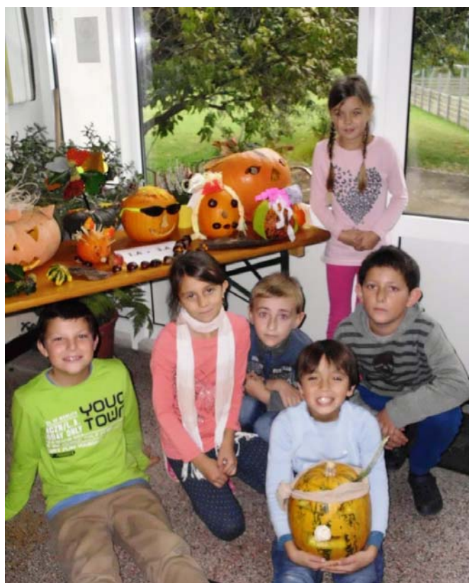
Niečo z tekvičkovej výzdoby