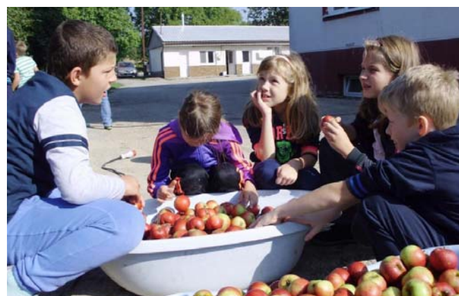
...pri výrobe jablčného muštu