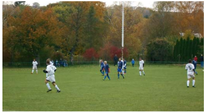
Na hracej ploche hráči oboch mužstiev sa snažili