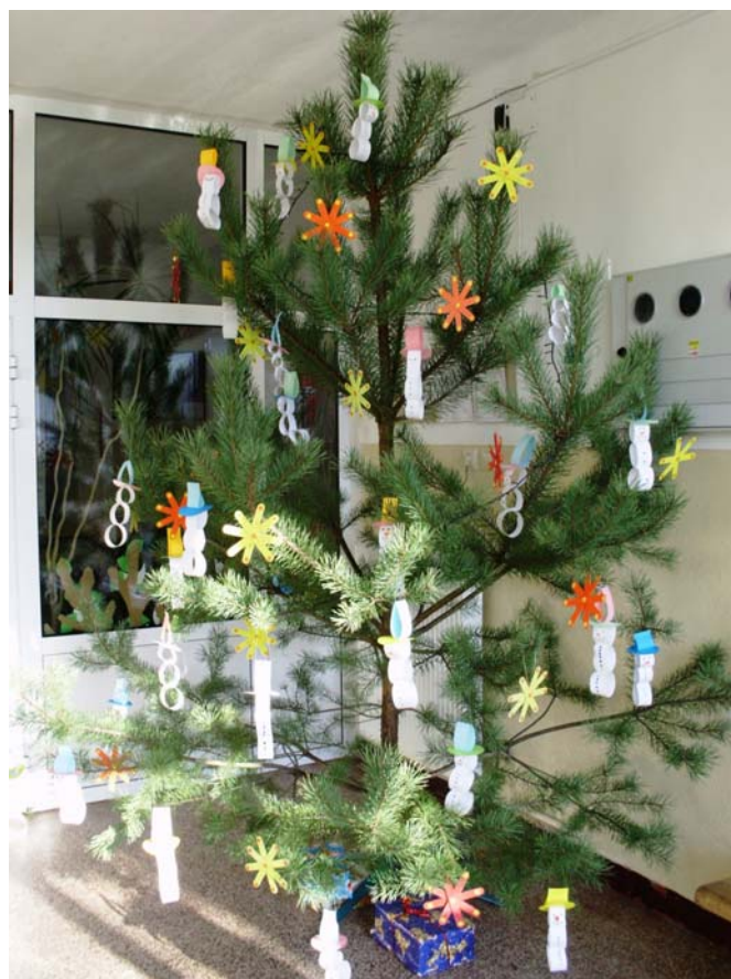
Vianočná krása vo vestibule

za deň zažije viacero Vianoc. Vyvrcholením predvianočných príprav sú však Vianočné trhy, ktoré sa konajú každoročne na Obecnom úrade v Lubine. Tu majú možnosť triedy získať peniažky do triedneho fondu predajom vlastnoručne vyrobených dekoratívnych predmetov s vianočnou tematikou. Koledy, prí-