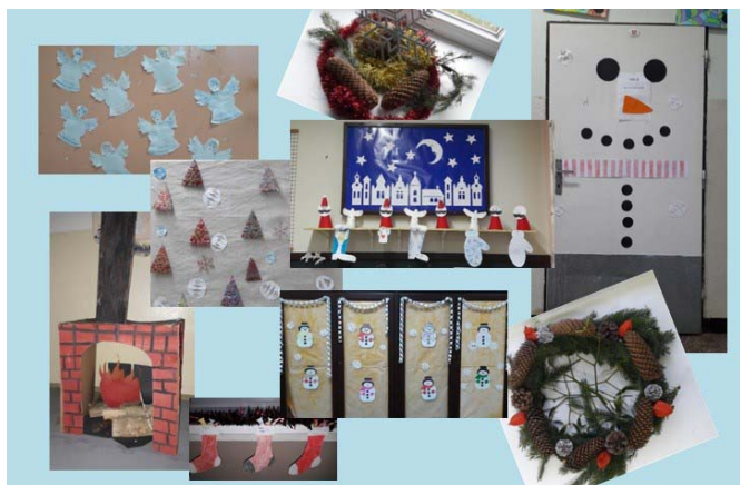
Vianočná výzdoba v triedach