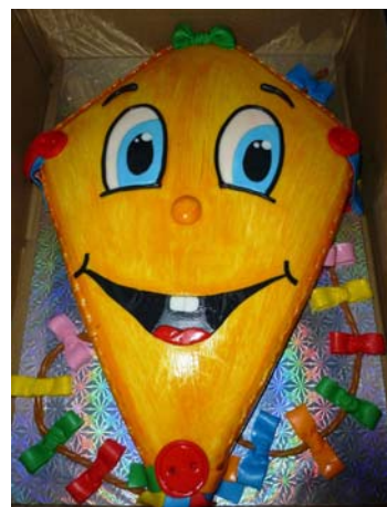
Dar od Boršičanov – tematická torta