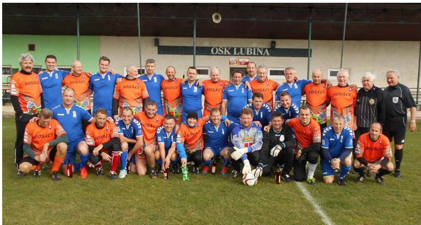
Spoločné foto aktérov zápasu