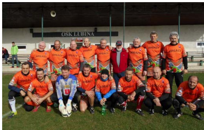
Sosáci Stará Turá