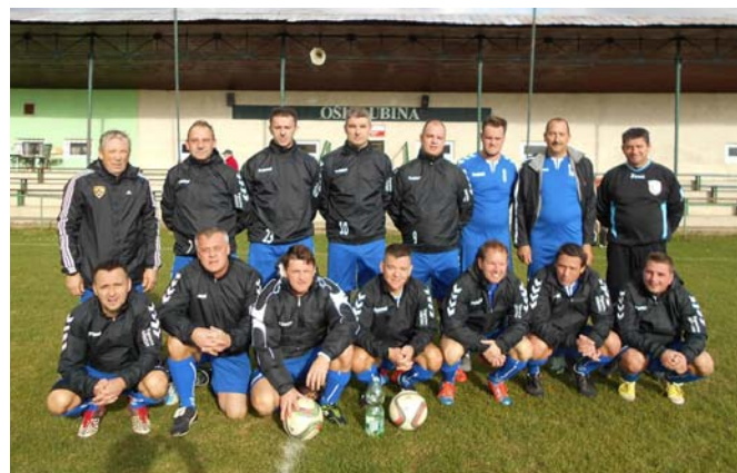
ŠD Ruperče – Trčova