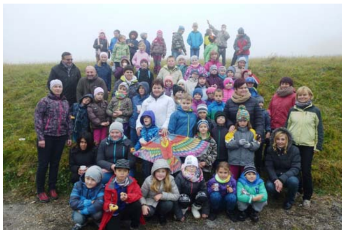
Spoločná fotografia účastníkov akcie na Veľkej Javorine

Každoročne v októbri sa žiaci našej školy tešia na „šarkaniádu“. Pestrofarebné šarkany ovládli jesennú zachmúrenú úlohu. I keď nám počasie neprialo, šarkany veselo lietali nielen našim žiakom, ale i žiakom z družobnej obce Boršice u Blatnice, ktorých sme pozvali na Veľkú Javorinu.