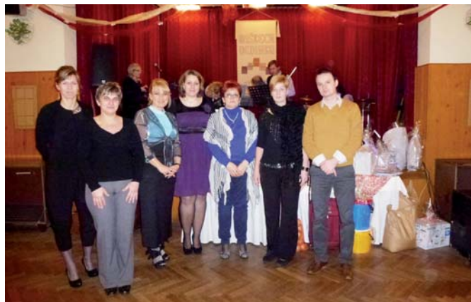
Organizátori spoločenského plesu