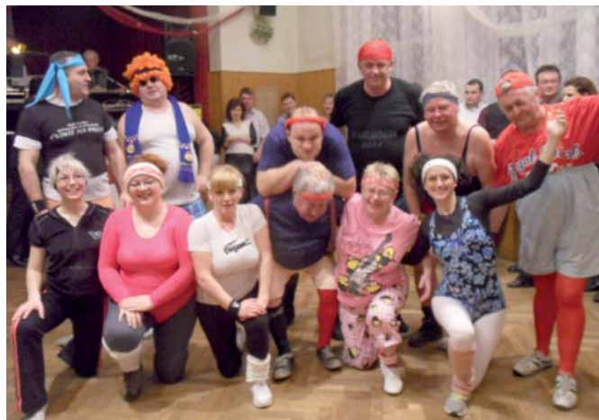
Scénka – „Bud' fit“