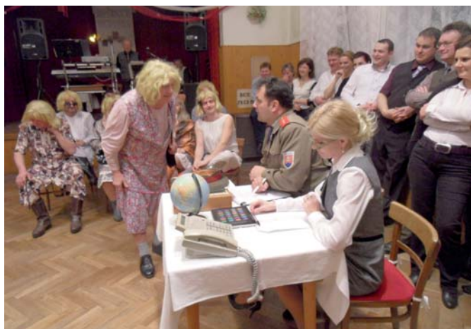
Scénka – „Konkurz“

hudobného nástroja - basy, pri ktorom vystupovali postavy kňaza, kostolníka i smútiacich pozostalých. Na záver zábavy basu symbolicky pochovávajú.