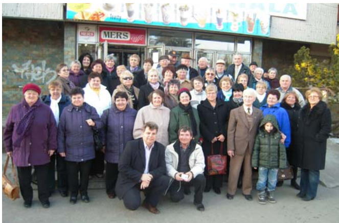
Spoločné foto účastníkov zo Starej Turej, Lubiny, Hrušového, Bziniec pod Javorinou

V Trenčíne, v zaplnenej športovej hale, sa 5. marca 2013 uskutočnili dôstojné, krajské oslavy Medzinárodného dňa žien.