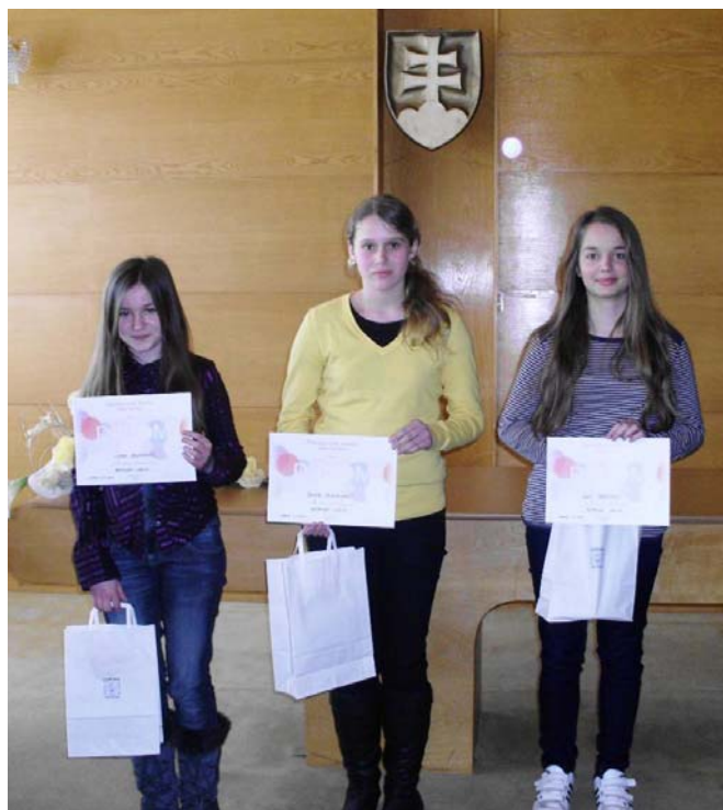
víťazky II. kategórie

Ďakujeme všetkým, ktorí nám toto pekné podujatie pomohli zorganizovať a Obecnému úradu v Lubine za poskytnutie dôstojných priestorov.