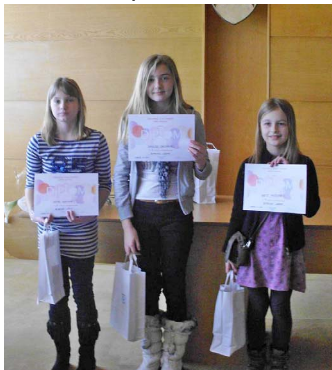
1: víťazky I. kategórie

Zblízka i zďaleka sa 3. apríla 2013 od skorého rána hrnuli malí