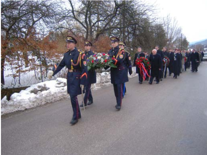
Sprievod k pamätníku padlých