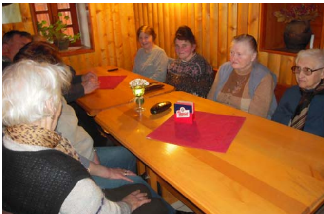
Pohľad na časť zúčastnených členov