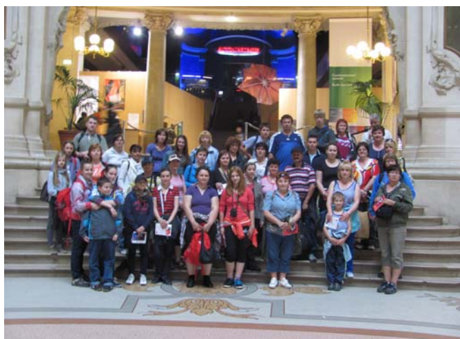
V Paláci objavov

v roku 1914. Základným stavebným materiálom je travertín, preto je bazilika stále biela. Po výstupe po 234 schodoch sme mali nádherný výhľad na celý Paríž. Po prehliadke baziliky Sacré-Couer sme išli autobusom na námestie Trocadero, odkiaľ sme si vyfotografovali celú Eiffelovu vežu. Potom sme sa už presunuli pod „Eiffelovku“. Z Eiffelovej veže sme mali nádherný výhľad na Paríž, dalo sa vidieť, aký je vlastne Paríž veľký. Už vo večerných hodinách sme absolvovali plavbu po rieke Seina. Z paluby lode sme si pozreli krásne rozsvietené pamiatky. Jedna z najkrajších rozsvietených pamiatok bola Eiffelova veža, ktorá svietila na žltu a neskôr začala blikáť na bielo. Úžasný zážitok.