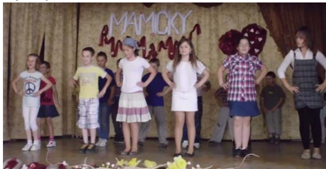
Tanečné vystúpenie žiakov ZŠ

28.6.2013 je slávnostné ukončenie školského roka 2012/2013 spojené s odovzďávaním vysvedčenia. Touto cestou želim všetkým kolegom, žiakom i rodičom krásne, slnečné a hlavne oddychovo aktívne letné prázdniny a dovolenky a teším sa na stretnutie v prvý školský deň ďalšieho školského roka 2013/2014, v pondelok 2.9.2013 o 8:00 pred budovou základnej školy.