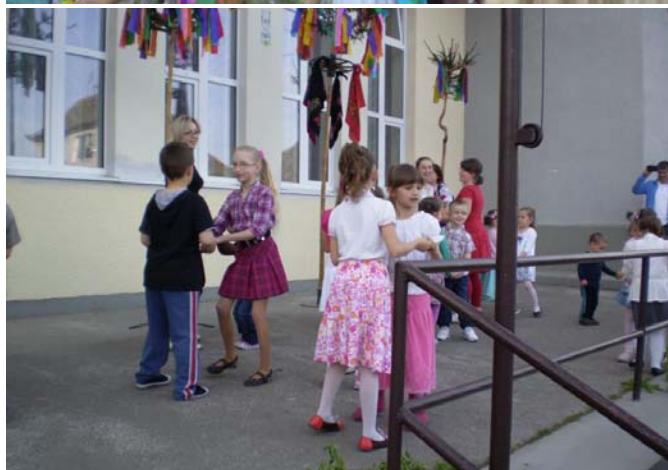
prvé vystúpenie DFS Javorinka