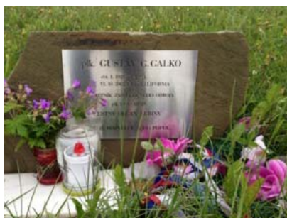
pamätník plk. Gustáva Galku