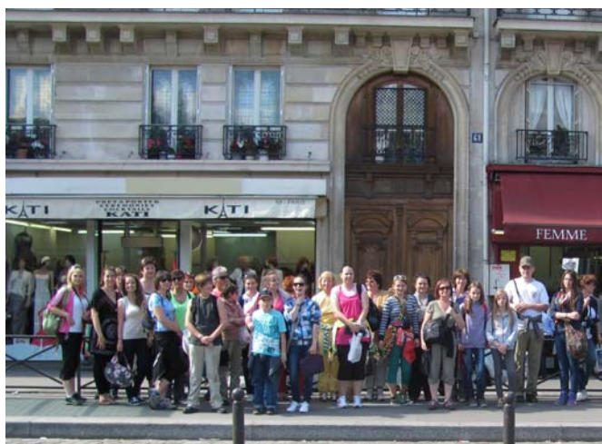
V uliciach Paríža

západom, vzápätí sme sa ocitli v oriente, hneď na to sme boli na pirátskej lodi... Disneyland má 20 km 2 . Stretli sme postavičky z rôznych rozprávok. V Disneylande, kde sme strávili celý deň, sme sa poriadne vybláznili a zabavili. Večer sme sa stretli pri autobuse a už nás čakala len cesta domov, návrat do našej rodnej krajiny - na Slovensko!