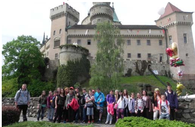
Spoločná fotografia pred Bojnickým zámkom

Vo štvrtok 2. mája som vôbec nemohla zaspáť, pretože na ďalší deň mal ísť druhý stupeň na výlet do Bojníc. Čakal nás Bojnický zámok a strašidelný majáles, ZOO a Laugarício. Keď sme nastupovali do autobusu, každý sa tešil na nový zážitok. Cesta ubehla veľmi rýchlo.