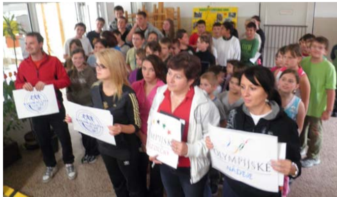
Nastúpenie súťažných družstiev v jednotlivých kategóriách

I tento rok sme sa snažili pripraviť našim deťom k ich sviatku niečo netradičné a zaujímavé, a tak sme sa rozhodli, že spoločne nestrávime len doobedie, ale i poobedie, večer a noc. Nadšenie detí bolo veľké, ochota rodičov taktiež. Vo štvrtok 30. 5. si deti okrem školských tašiek priniesli aj spacáky, podušky