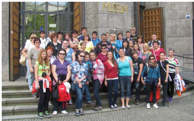
Paríž Disneyland Mníchov 2013

Keď na hodinách naskočil čas 02:00 ráno, všetci sme stáli nastúpení pred Základnou školou S.Štúra v Lubine a pripravovali sme sa na dlhú cestu, ktorá končila až v Paríži.