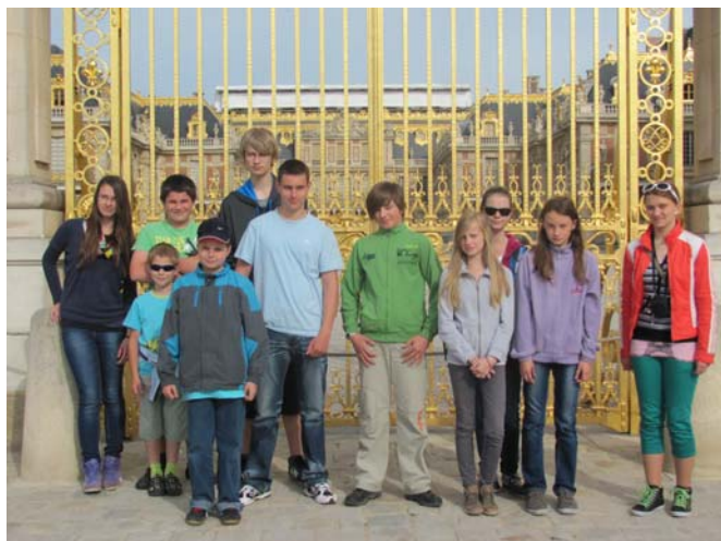
Mládež pred bránami Versailles

(Place de la Concorde). Neskôr sme videli Invalidovňu (Les Invalides), kde je pochovaný Napoleon Bonaparte. Ďalšia pamiatka, ku ktorej nás naše dve sprievodkyne dovedli, bol Notre Dame-Chráam Matky Božej, katedrála ktorá prešla mnohými prestavbami a mnohými štýlmi, preto je taká krásna a jedinečná. Sorbonne a Latinská štvrť – dve miesta, ktoré sú najviac spojené so študentmi. Latinská štvrť (Quartier Latin) získala svoje meno vďaka tomu, že bola centrom vzdelanosti Paríža a latinčina bola vyučovacím jazykom. Práve tu sa nachádza aj svetoznáma parížska univerzita Sorbonne. Ďalej sme boli v Luxemburských záhradách (Jardins du Luxembourg). Nachádza sa tu Luxemburský palác (Palais du Luxembourg), ktorý bol pôvodne postavený pre Mariedu Medicis, v súčasnosti tu sídli francúzsky Senát. Po prehliadke pamiatok Paríža sme sa išli ubytovať do hotela.