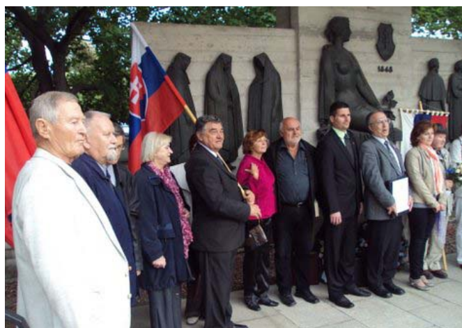
Záverečná pieseň účastníkov

Po skončení spomienkovej slávnosti si prítomní so záujmom prezreli exponáty Múzea SNR, ktorého návštevu, ale i účasť na budúcoročnej spomienkovej slávnosti, doporučujem všetkým, ktorí majú úctu k hrdinstvu a obetavosti našich predkov pri ich snahe zabezpečiť pre ďalšie pokolenia Slovákov lepšiu a dôstojnejšiu budúcnosť.