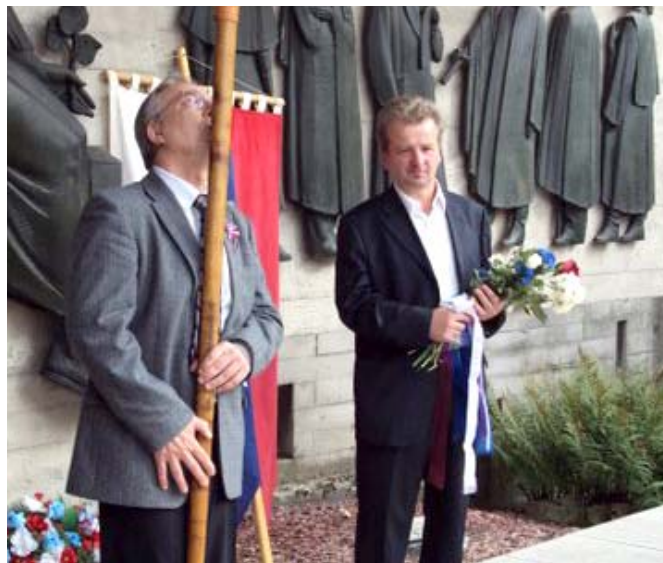
Fujara znela navôkol