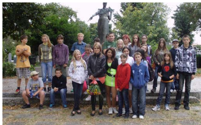
Mestský cintorín v Modre - miesto odpočinku L. Štúra