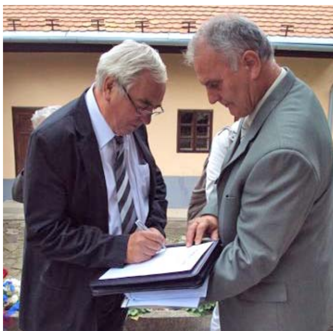
autor článku pri podpise do pamätnej listiny zo spomienky

Text a foto: JUDr. Viliam Rastislav Pagáč