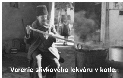
Varenie slivkového lekváru v kotle.