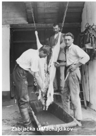
Zabijačka u Machajdíkov

Zabijačka bola veľmi očakávanou chvíľou i príležitosťou na stretnutie a pohostenie rodiny. V predvečer tejto rodinnej udalosti gazdiná nachystala hrnce, misy, krúpy, ryžu a všetky dôležité prísady vrátane domácej majoránky. Gazda nachystal koryto, kotol a do fľaše dobrú pálenku. Ráno sa všetci poschádzali, privítali sa kalíškom ostrého a už ťahali brava z chlieva. Gazdiná pribehla s misou na krv a keď sa podarilo brava dobre „omráčiť“ a pichnúť, mohli začať s opaľovaním a škrabaním srsti. Potom brava zavesili na trám, alebo trojnožku, rozrezali a už sa kmitalo s misami pre pečienku, črevá, deti dostali kúsok opáleného chrumkavého ucha a chlapi mali dôvod na pohár hriateho. A keď bol už